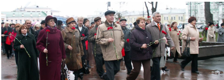
Ветераны комсомольского движения возлагают цветы к Вечному огню в г. Вологде, 29 октября 1998 года.

С первых дней войны комсомольцы проявили свой патриотизм, готовность защищать Родину. В архиве до наших дней сохранились заявления добровольцев, сведения о героических подвигах наших земляков на фронте и в тылу. В годы Великой Отечественной войны значительно усилилась роль сельских организаций. Сямженский райком