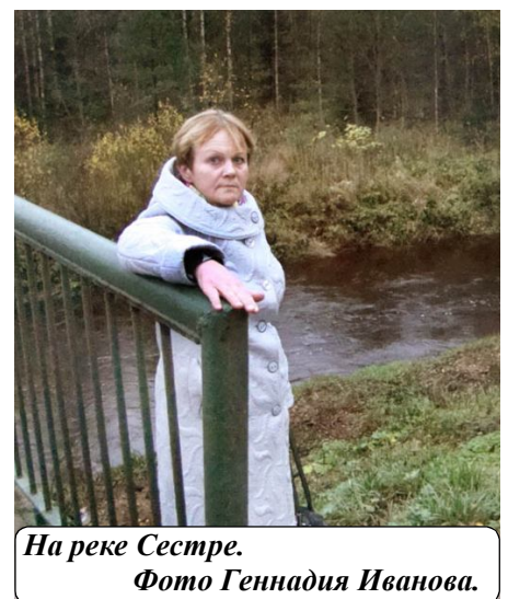
На реке Сестре.