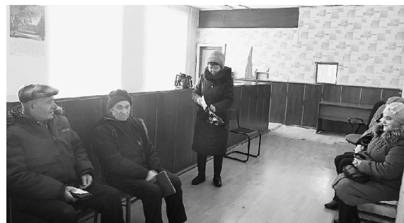
На этой неделе офиса ООО "Аквалайн" было многолюдно.

Граждане, которые претендуют на субсидию по оплате услуги по утилизации ТКО, могут подтвердить свое право в МФЦ по месту жительства в обычном порядке. Средства будут возвращены на счета льготникам, при этом сумма в "квитке" останется 100-процентной.