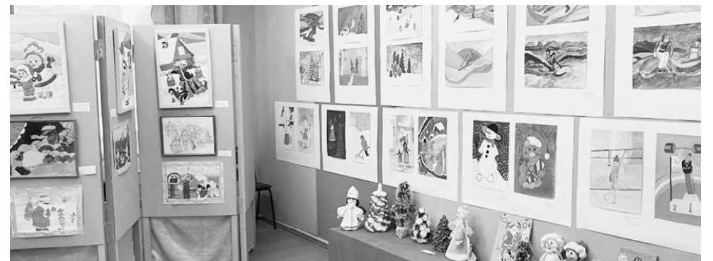
Работы учащихся ДШИ.