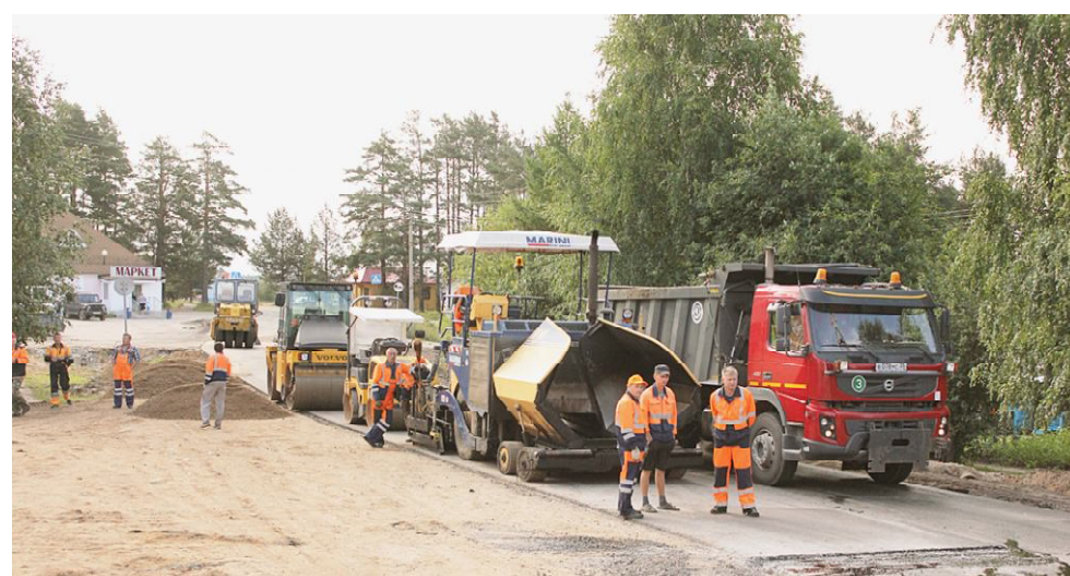
Ремонт дороги по улице Советской.

Беседовали Андрей СМОЛЯКОВ и Алексей КОЛОСОВ.