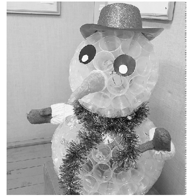
«Снеговик» - работа Н.А. Шutowой и Ксюши Скороходовой.