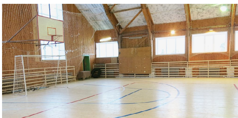
Внутри отремонтированного ФОКа.