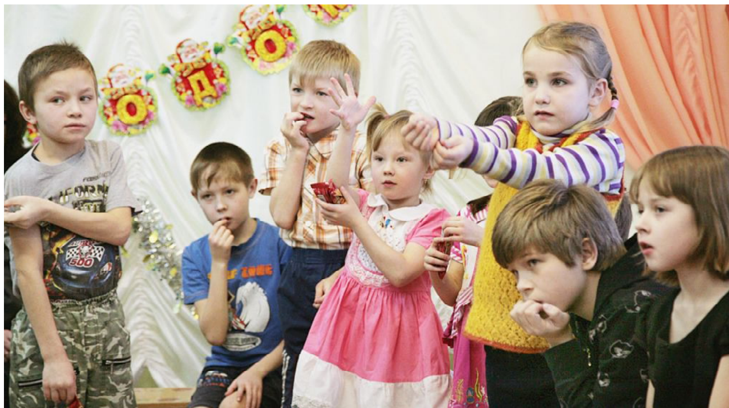
Отгадываем все загадки.