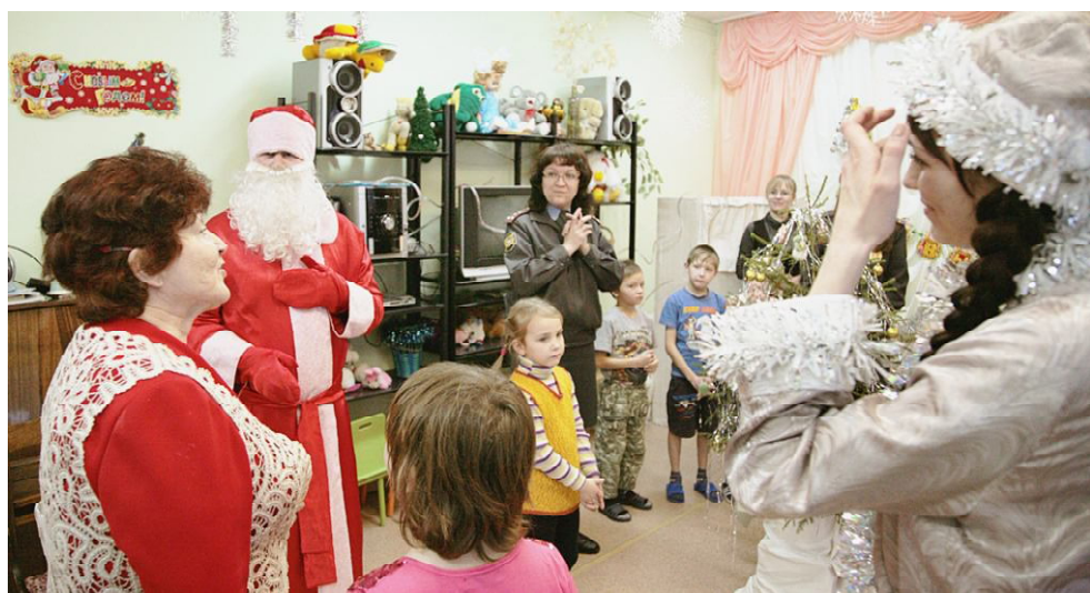
Веселимся вместе с гостями.