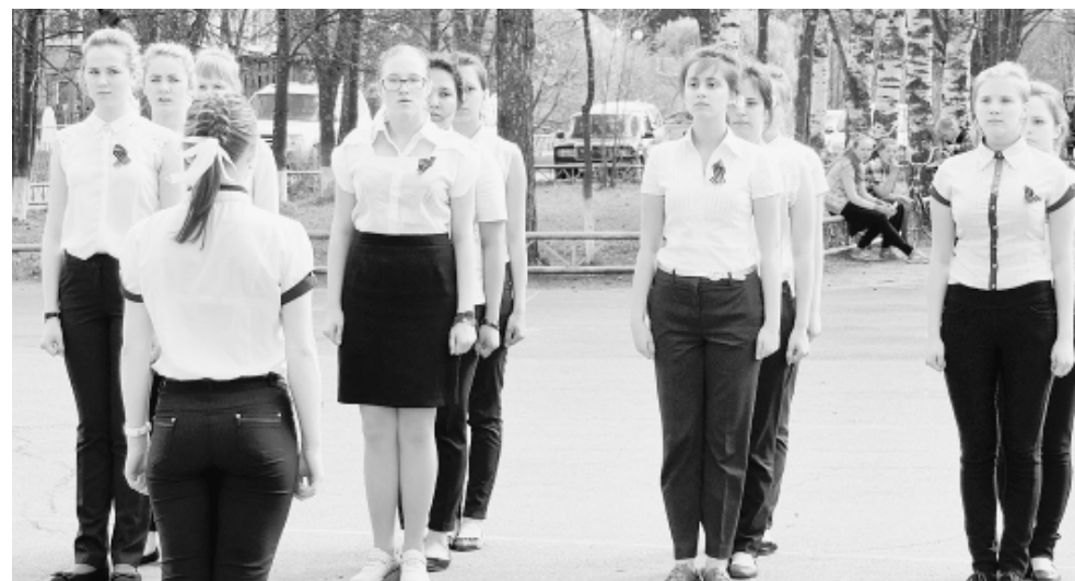
...и в Сямже.

Соб. инф.