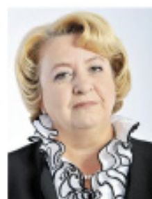
ЯЧЕЙСТОВА Людмила Георгиевна, депутат Законодательного Собрания Вологодской области