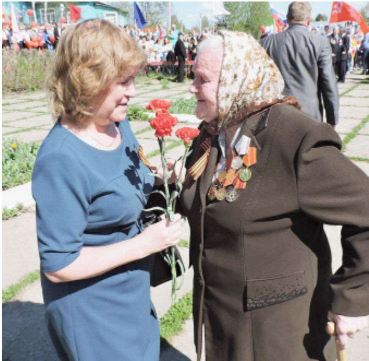
Дарите цветы ветеранам!