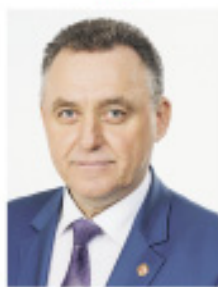
ШУЛЕПОВ Евгений Борисович, глава города Вологды