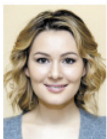
КОЖЕВНИКОВА Мария Александровна, депутат Госдумы РФ, антриса