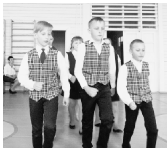
Смотр строя и песни в Гремячем.

Накануне 9 мая в Сямженской школе прошёл традиционный смотр строя и песни, посвящённый Дню Победы. За звание "лучших" боролись пять отрядов учащихся 9-11 классов.