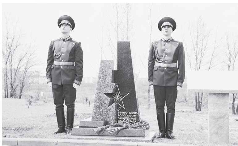
Памятник вологжанам - защитникам Сталинграда на Мамаевом кургане.

Управление информационной политики Правительства Вологодской области.