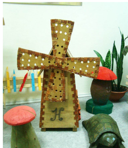
Подделки ребят украсят любой сад - огород.

Главная задача творческого конкурса - сделать красивым и ухоженным пришкольный участок. Мне кажется, что ребята и их родители смогли её выполнить на все сто процентов. Думаю, что и вы, уважаемые читатели, увидев эту сказочную страну, со мной согласитесь.