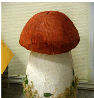
Гриб так и просится в корзинку.