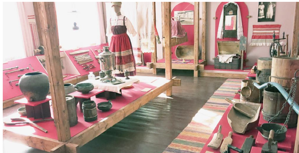
В новом музее.