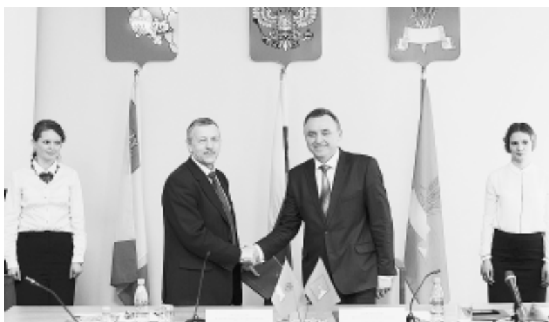
Подписание соглашения. Именно с этого события начинался проект «Забота» в нашем районе.

Пресс-служба УФСБ России по Вологодской области.