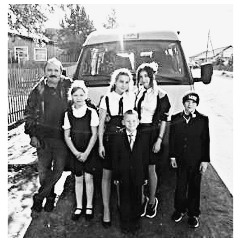
В День знаний новый автобус доставил учеников на школьную линейку.