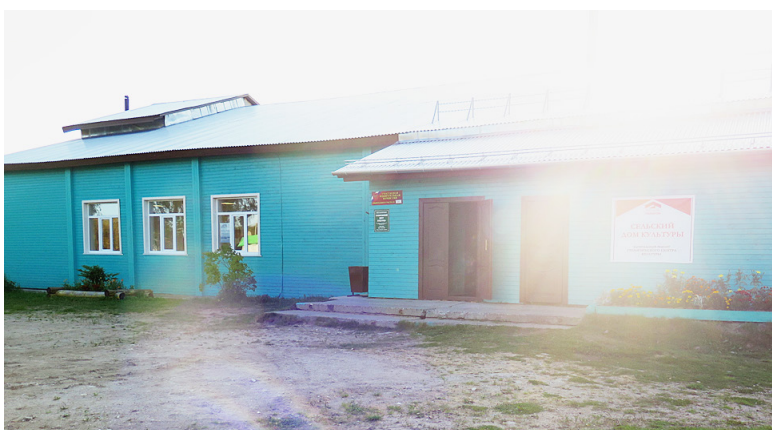
Фасад обновленного по программе «Сельский дом культуры» Гремячинского ЦК еще ярче заиграл в лучах осеннего солнца.