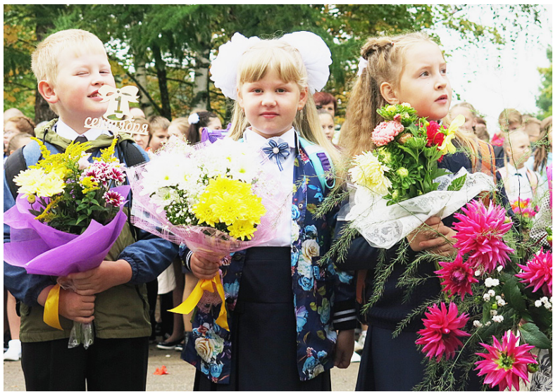
Лишь только лето отшумело, шуршит сентябрьский ветерок, и приглашает всех ребят он на первый праздничный звонок.