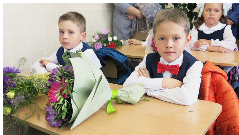
Первый класс! Первый класс! Есть учебники у нас! Ручки и карандаши – мы уже не малыши!