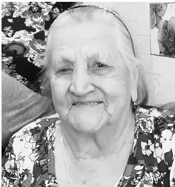
Ольга Михайловна с годами не потеряла бодрости духа.

У Смирновых всегда было большое подсобное хозяйство с домашними животными и огородом. Дети с малолетнего возраста приобщались к труду, во всем помогали родителям.