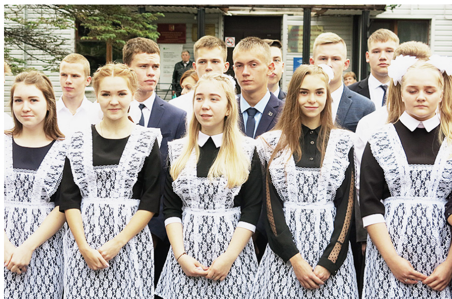
Однадцатиклассники – будущие выпускники 2020 года.