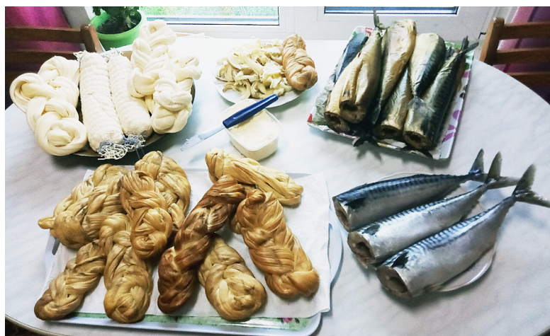
Настоящий сямженский продукт.

лено с большой любовью. А уж вкус... настоящий сямженский продукт. Не случайно отзывы о нем у наших земляков только положительные.