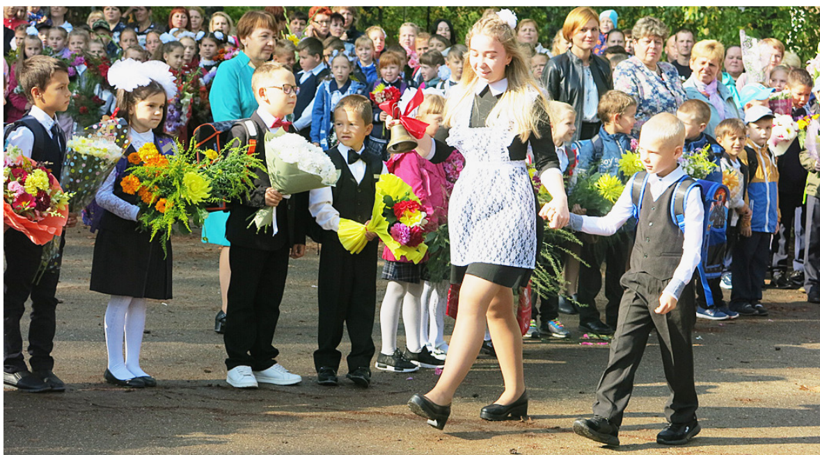
Каждый год звонок веселый собирает вместе нас. Здравствуй, осень! Здравствуй, школа! Здравствуй, наш любимый класс!

В нынешнем мире как никогда важны знания, полученные в школе. Чтобы постигать азы науки, у школьников