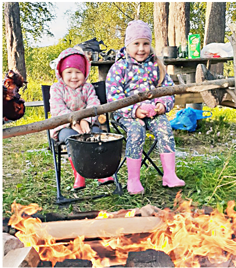
Фотография, ставшая лучшей в конкурсе.