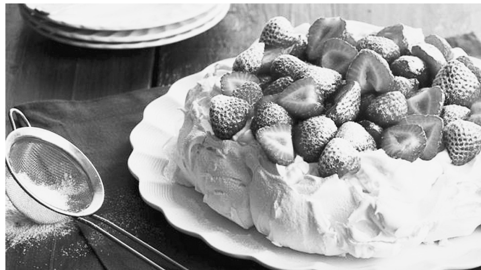
Торт «Павлова» — изысканный десерт для настоящих ценителей.

Теперь непосредственно переходим к процессу приготовления и надеюсь, наша схема и пошаговая инструкция помогут вам приготовить легкий и воздушный десерт.