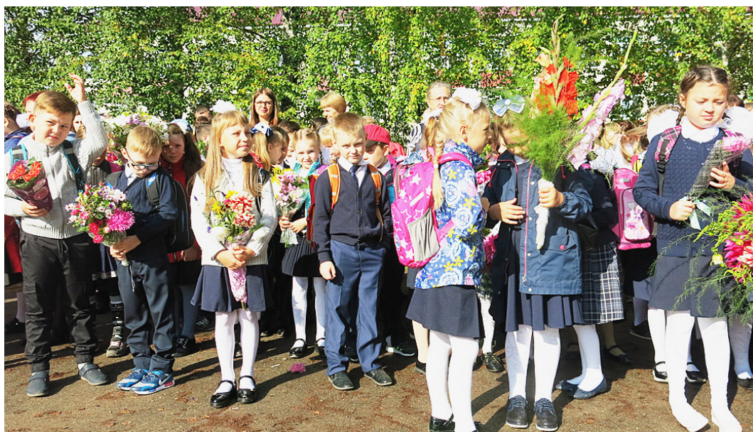
Лучший праздник сентября – это знаний день, друзья.