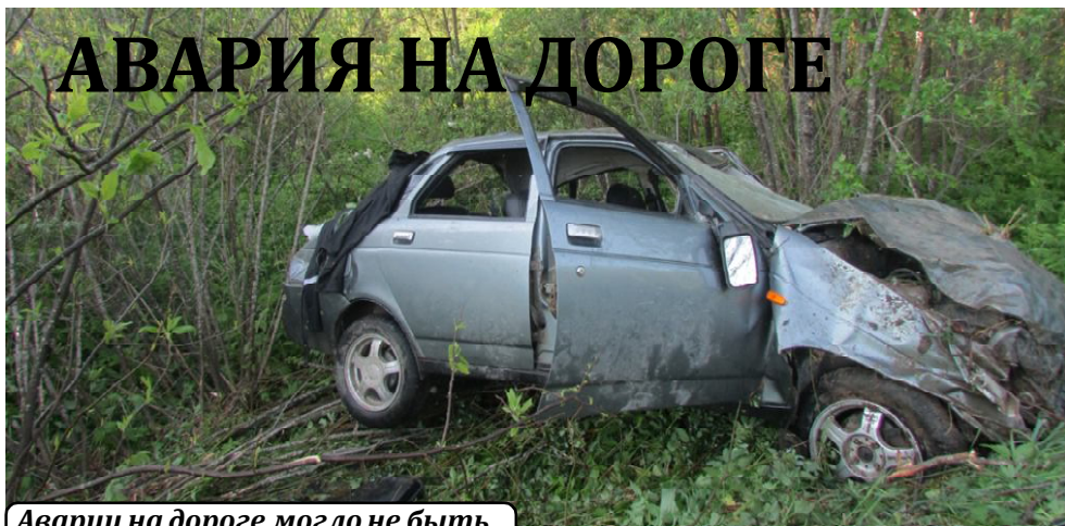
Аварии на дороге могло не быть.

Утром десятого июня на 622 километре автодороги Москва-Архангельск произошло дорожно-