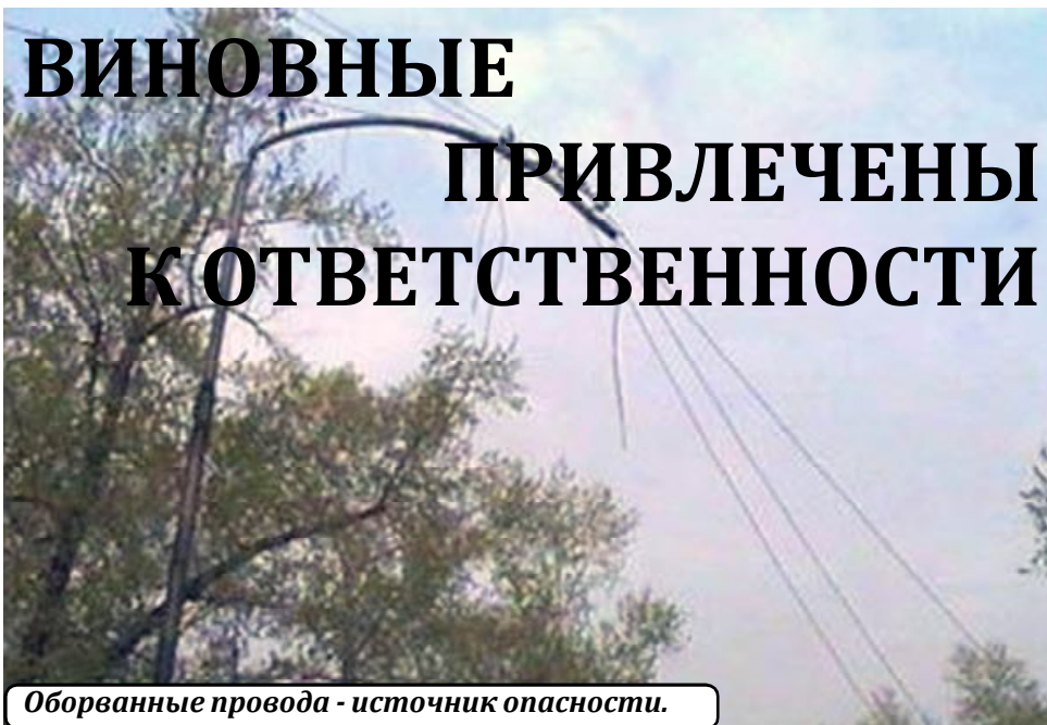
Оборванные провода - источник опасности.

Энергетики предупреждают: несанкционированное нахождение в охранных зонах линий электропередачи может быть опасно для жизни!