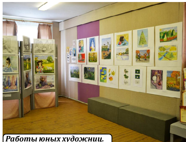
Работы юных художниц.

Выставка в школе искусств будет работать до конца месяца. Те же, кто не успеет побывать на ней, смогут посмотреть работы юных художниц на Бельтяевской ярмарке.