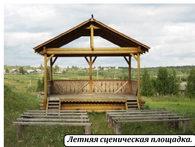
Летняя сценическая площадка.