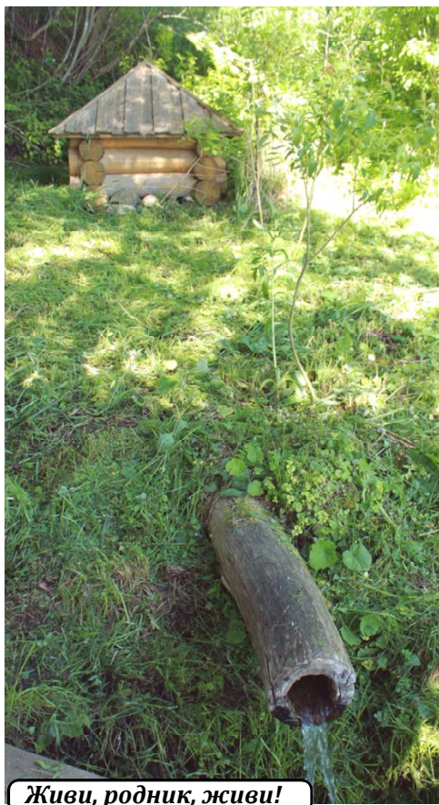
Живи, родник, живи!

Добавим, что для участия в конкурсе "Родники Вологодчины" приглашаются вологжане, живущие на территории