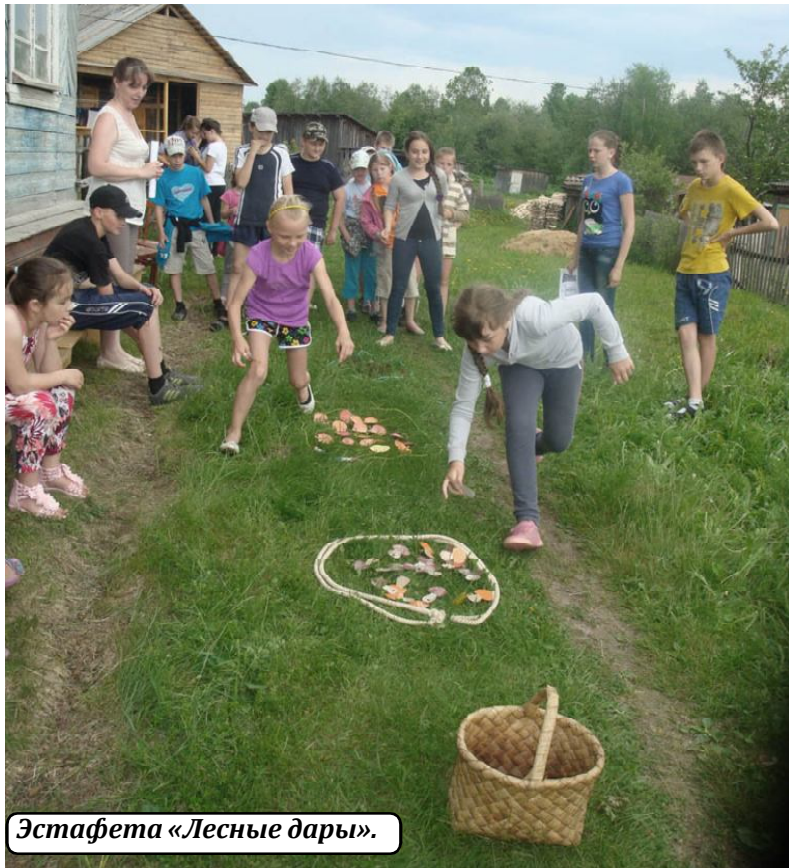
Эстафета «Лесные дары».

В завершение мероприятия дети посмотрели фотовыставку "Знакомые незнакомцы".