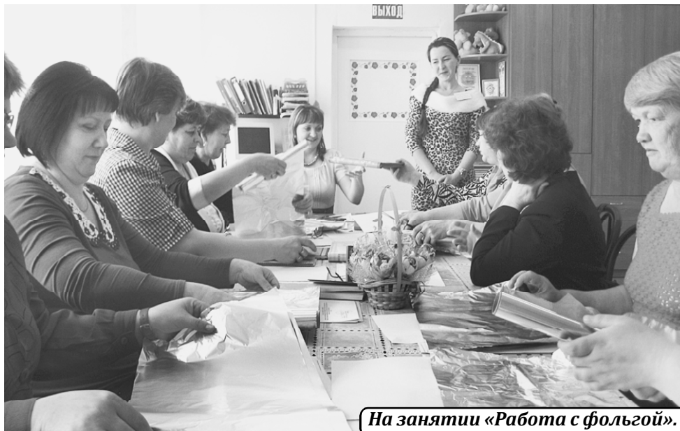
На занятии «Работа с фольгой».

семьях воспитывается сорок один ребенок из числа детей-сирот и детей, оставшихся без попечения родителей. Из них восемьдесят один процент - это дети, чьи родители лишены родительских прав. Основные причины лишения родительских прав - невыполнение родителями обязанностей по воспитанию, содержанию, обучению и уходу за своими детьми, злоупотребление спиртными напитками, оставление детей в ситуациях, угрожающих их жизни и здоровью. При принятии решения о лишении родительских прав все же приоритетным остается сохранение ребенка в его родной семье. Именно поэтому так важно действовать сообща в решении проблем неблагополучия семей, выяв-