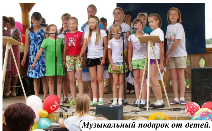
Музыкальный подарок от детей.