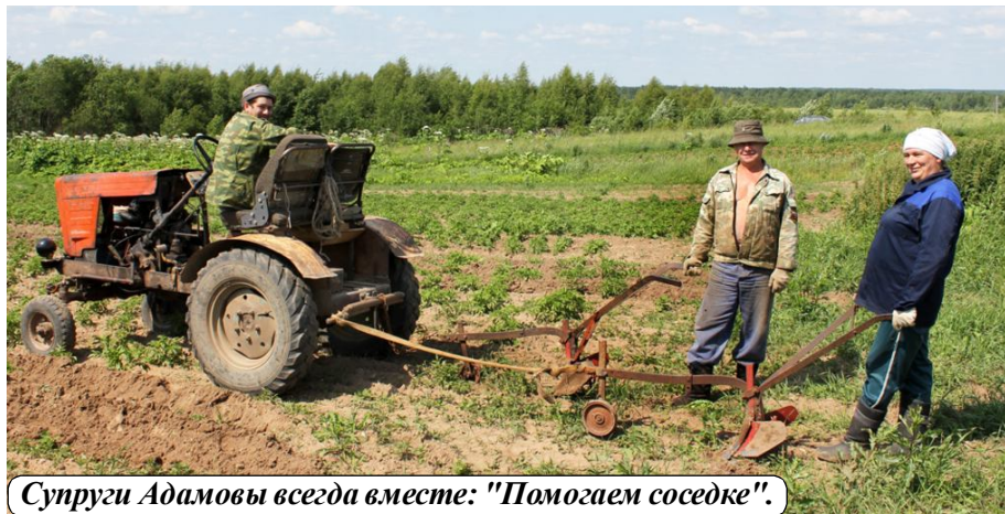
Супруги Адамовы всегда вместе: "Помогаем соседке".