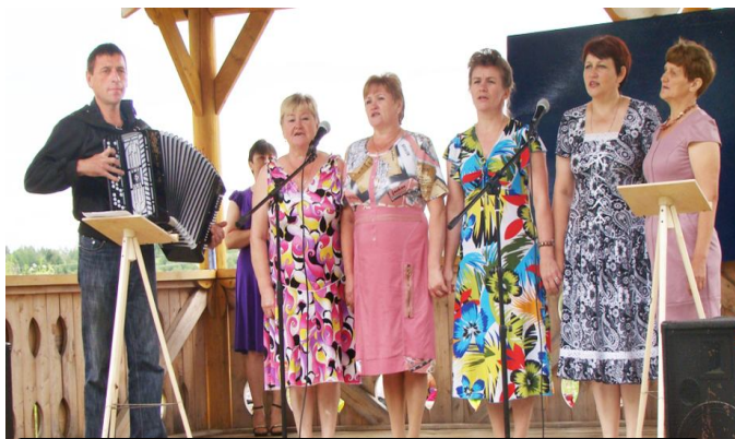
На сцене женский ансамбль с песней «Деревня».

Центральным событием праздника, конечно же, стал концерт, в ходе которого чествовали местных жителей. Трём малышам, родившимся в этом году, -