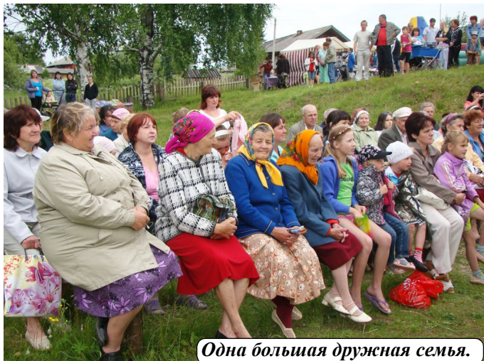
Одна большая дружная семья.