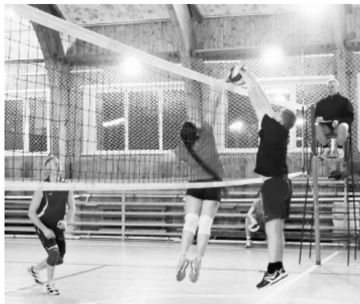
На площадке "Сборная" и "Школа".