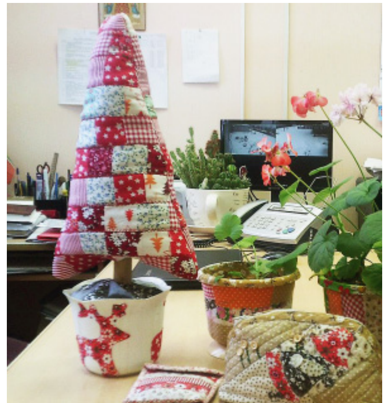
Замечательные работы получают у Ольги Семёновой, которая увлекается лоскутной пластикой.