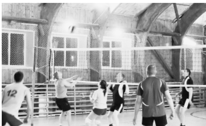
Поединок между командами "Мастер" и "Дорожник".

"Декабрьский чемпионат проводился в формате 4х4, то есть применялись смешанные правила обычного волейбола и пляжного. В течение месяца шесть команд боролись за пальму первенства. В заключительный день соревнований, 23 декабря, первыми на площадку вышли "Двиница" и "Ветеран". Хотя эти команды и не участвовали в распределении призовых мест, но их игра запомнилась болельщикам упорством, которое проявили оба коллектива. Невозможно было предугадать исход встречи. В итоге "Двиница" вырвала победу у своих более опытных соперников со счётом 3:1. В следующем поединке между командами "Школа" и "Сборная" определялся "серебряный" призёр чемпионата. После первых двух партий была ничья, а вот в третьей и четвертой - волейболисты "Школы" уверенно обыграли соперников. Побе-