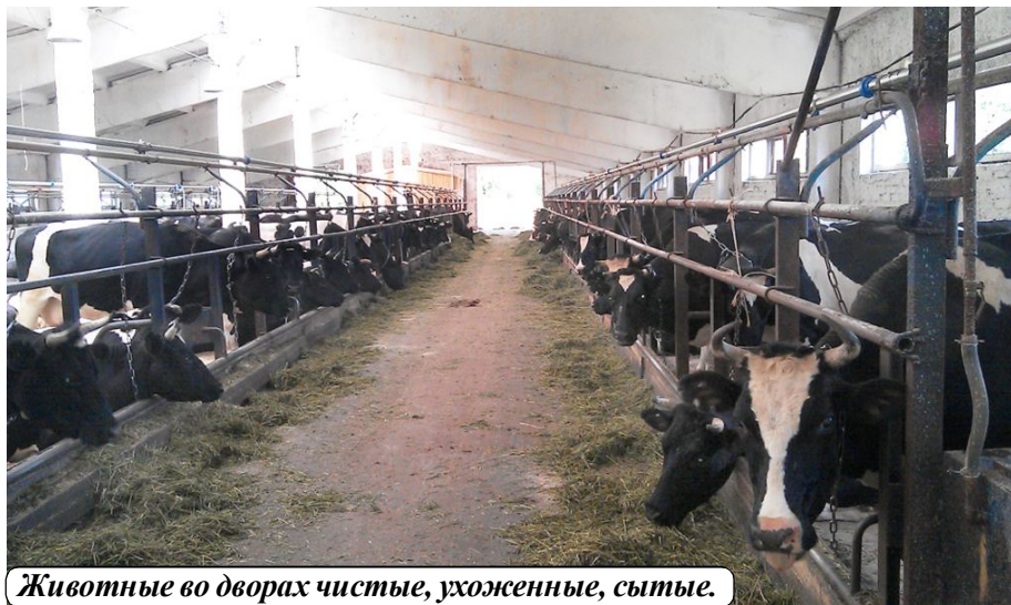
Животные во дворах чистые, ухоженные, сытые.