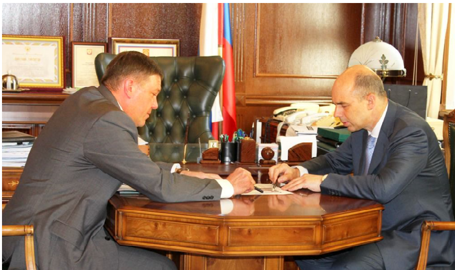
Губернатор области Олег Кувшинников на приёме у министра финансов Антона Силуанова.

Два с половиной миллиарда рублей финансовой помощи получит Вологодская область для сбалансированности бюджета региона.