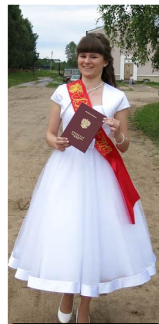
Пусть дорога жизни будет ясной!

Накануне Дня молодежи пятьдесят шесть выпускников Сямженской средней школы получили аттестаты о среднем образовании.