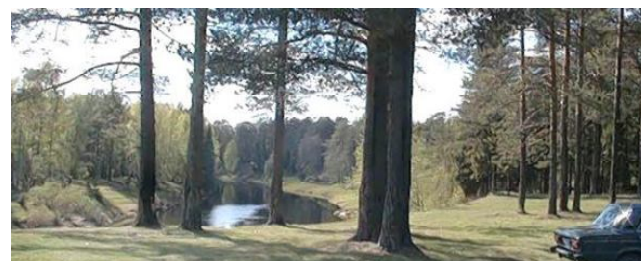
Пресс-служба Губернатора Вологодской области.

Рослесхозом рекомендовано разработать аналогичные документы в других субъектах Российской Федерации.