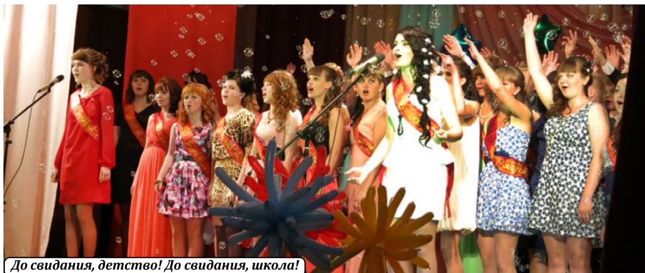
До свидания, детство! До свидания, школа!

Затем он вручает пяти выпускникам аттестаты о среднем образовании для награждения золотой медалью за особые успехи в учении, а медали им вручил 24 июня Губернатор Вологодской области. Золотые медалисты - не только отличники в учебе и призеры районных и областных олимпиад по