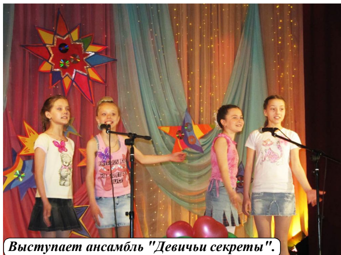
Выступает ансамбль "Девичьи секреты".