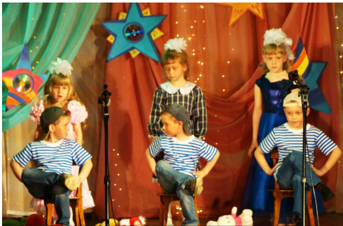
Шуточный танец "Хулиганы" (детский сад № 2).

В районном центре культуры двадцатого мая выступали самые юные жители нашего села - воспитанники детских садов райцентра. Это был своеобразный отчетный концерт - фестиваль детского музыкального творчества "Маленькая страна", в котором дошколята вместе со своими музыкальными руководителями показали все, чему они научились за этот учебный год.