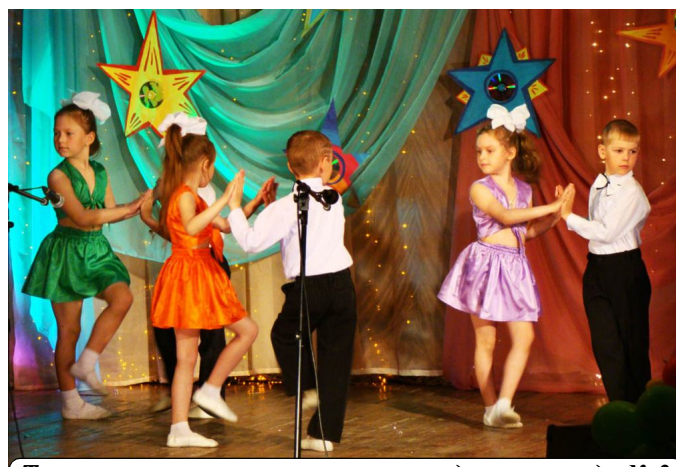
Танго в исполнении воспитанников детского сада № 3.

Многочисленные вспышки фотоаппаратов, видеосъемка, громкие и дружные аплодисменты зрителей, среди которых, конечно же, были родите-