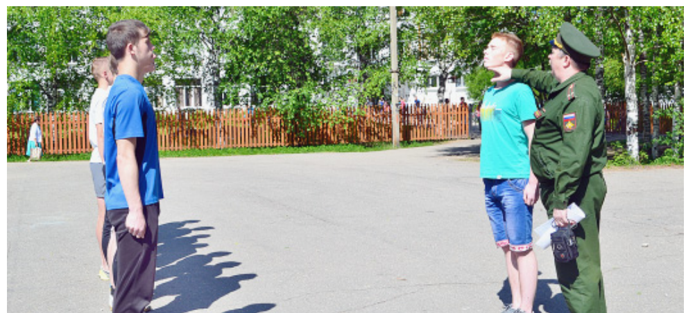
Всё внимание - строевой стойке...