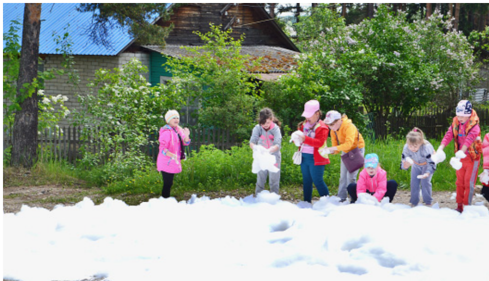
Дети пришли в восторг от обилия пены...