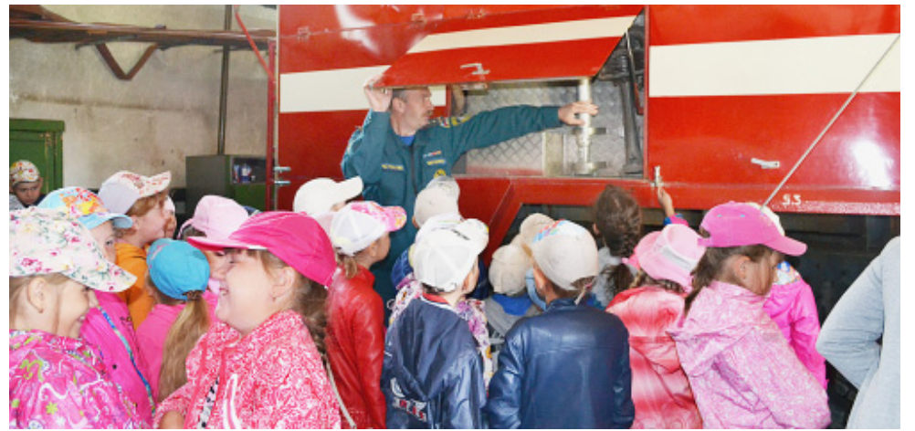
В гараже боевых машин...

Большое впечатление на ребят произвел выезд пожарной техники. Огнеборцы показали работу пожарных стволов, условное тушение возгорания водой и пеной, для изготовления которой используется специальный пенообразователь для пожаротушения.