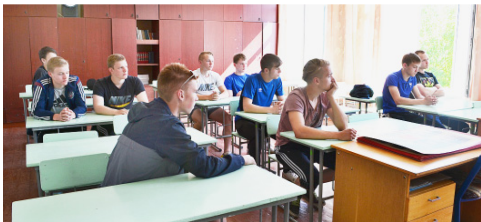
Программа сборов включала как практические, так и теоретические занятия...