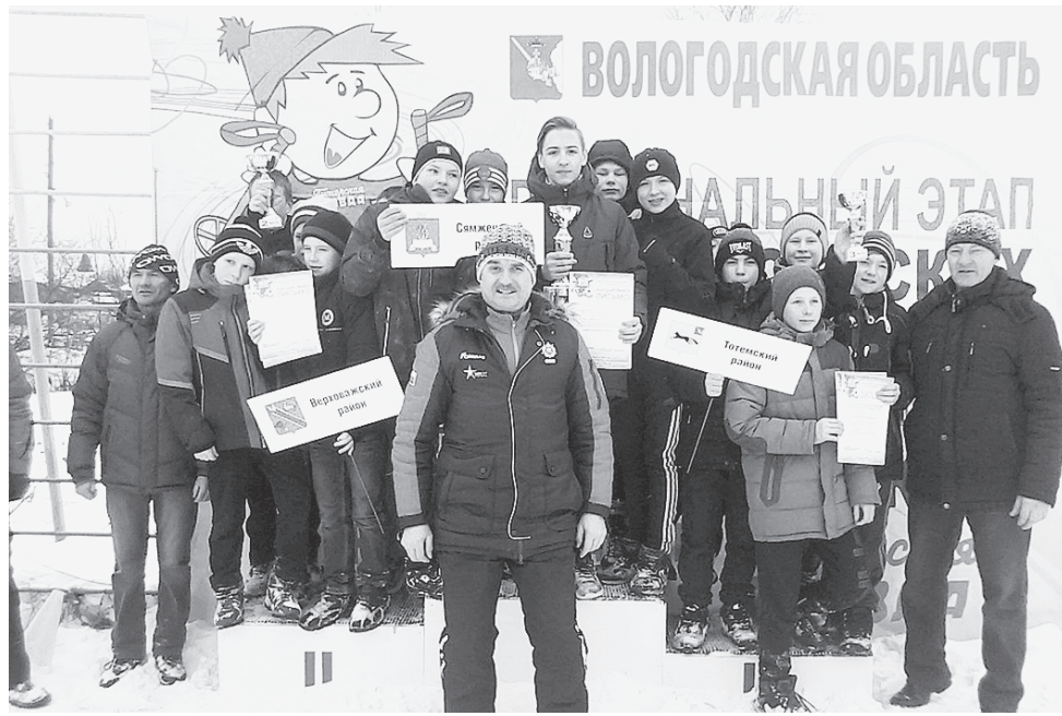
В 2018 году команда мальчиков 2004-2005 года рождения стала победителем Областных соревнований Департамента образования среди младших и старших школьников.