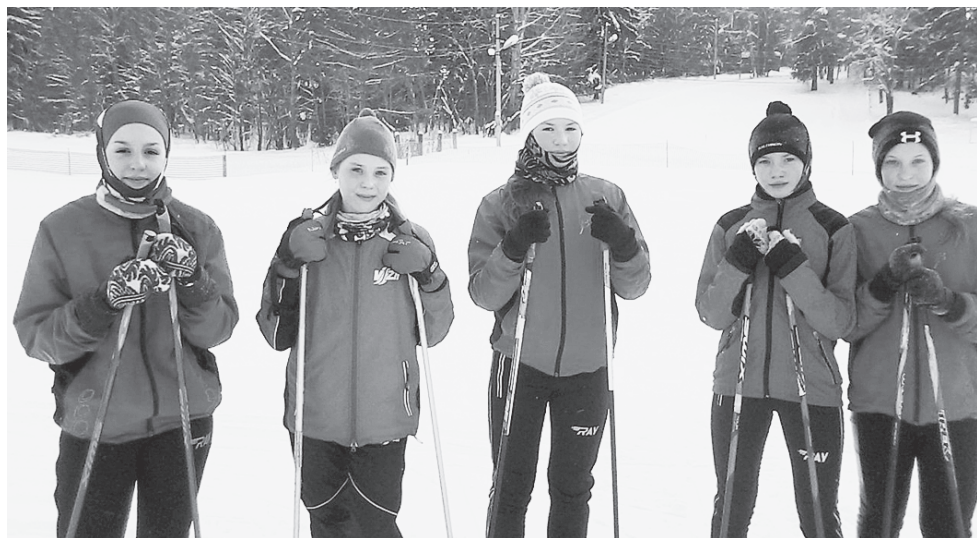
Молодое поколение сямженских лыжников.