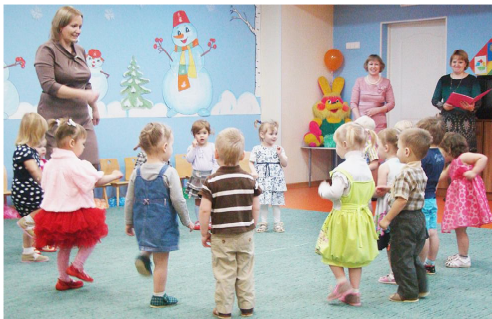
«Мы и пляшем, и поём».