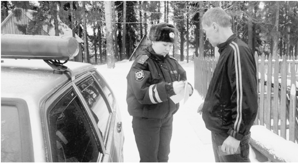
Долги рано или поздно наступят.