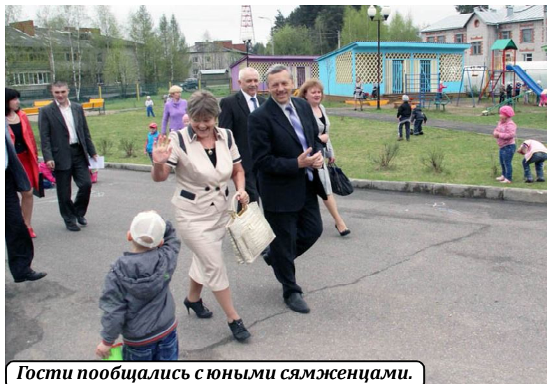
Гости пообщались с юными сямженцами.

Шестнадцатого мая в Сямже состоялось выездное заседание постоянно-го комитета Законодательного Собрания Вологодской области по образованию, культуре и здравоохранению на тему "Актуальные проблемы сфер образования, здравоохранения и культуры".