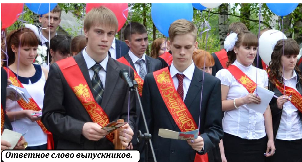
Ответное слово выпускников.

В субботний день, 25 мая, на площади у Сямженской средней школы состоялся праздник "Последнего звонка" для пятидесяти шести выпускников одиннадцатых классов. Поприветствовать их пришли ученики младших классов, учителя, родители, друзья и жители райцентра.