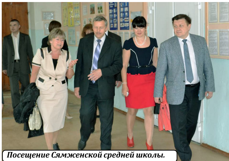
Посещение Сямженской средней школы.

бинете главы района. Затем было проведено расширенное совещание с участием депутатов местного самоуправления района, руководителей и специалистов отделов районной администрации, глав сельских поселений и их заместителей.