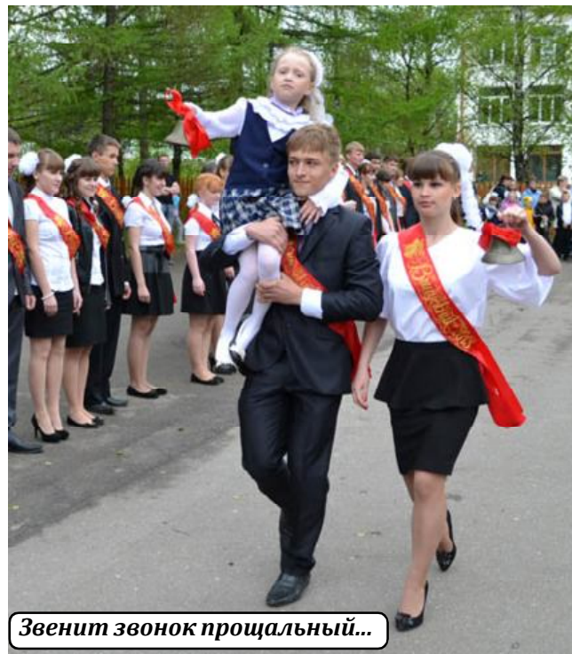
Звонит звонок прощальный...

По сложившейся доброй традиции в день последнего звонка выпускники исполнили вальс и, загадав заветное желание, выпустили