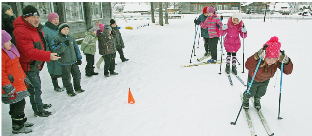
Первыми стартовали малыши.