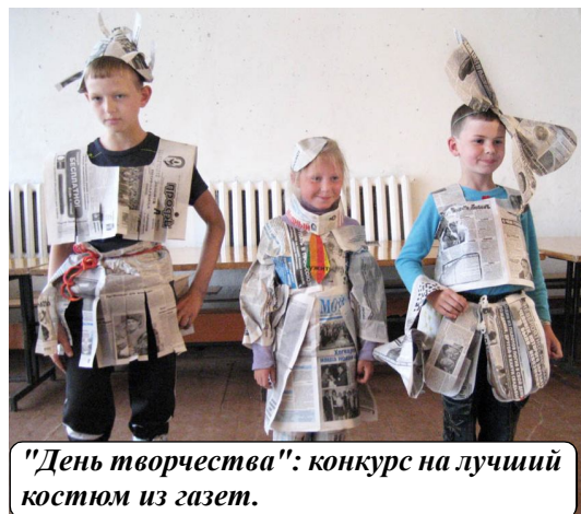
"День творчества": конкурс на лучший костюм из газет.

Валентина БЕЛЯЕВА.