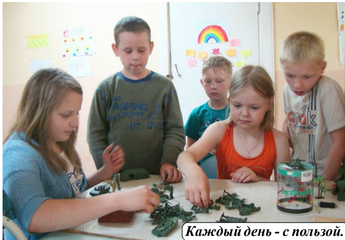
Каждый день - с пользой.