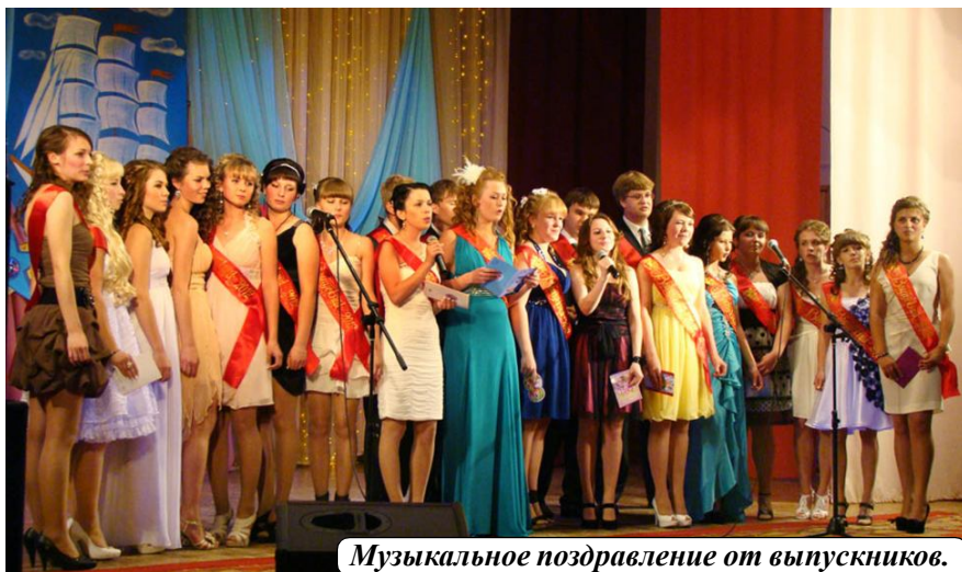
Музыкальное поздравление от выпускников.