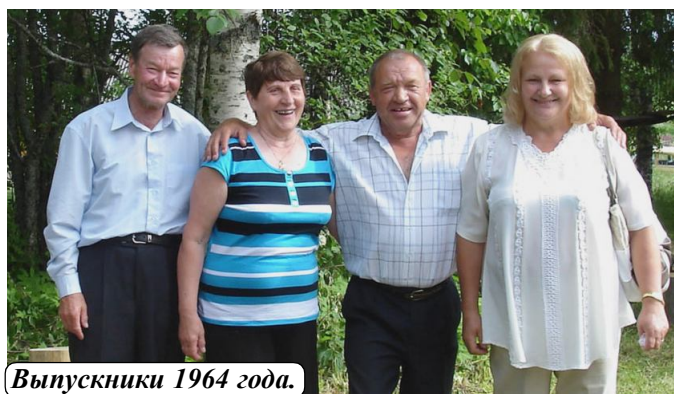
Выпускники 1964 года.