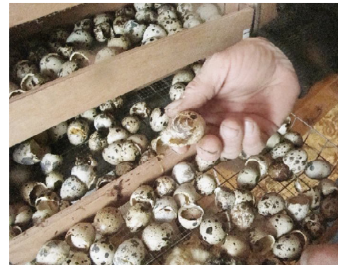
Первые минуты жизни маленького перепелёнка.

Глава хозяйства провёл меня в дом и с гордостью показал инкубаторы, в которых выводятся птенцов всех видов. Прямо на глазах яичная скорлупа сломалась, и наружу показалась крошечная головка перепелёнка. Ещё несколько крох шевелились рядом, в