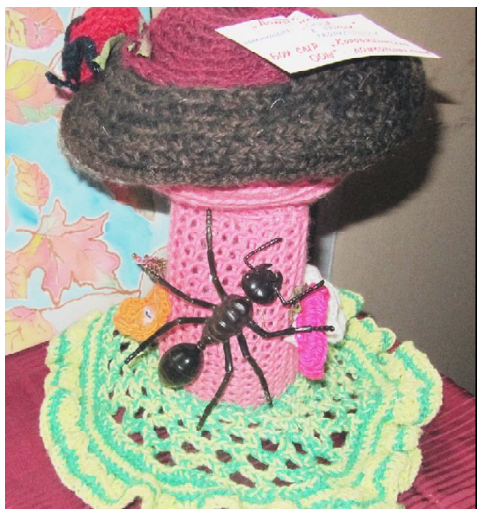
Композиция детей дошкольной группы Коробицынской школы.

22 октября в районном центре культуры стартовала районная выставка прикладного творчества "Разноцветные краски осени". Работы принимались по четырем номинациям: "Осенние краски в прикладном творчестве" (вязание, шитьё, бисероплетение, аппликация и так далее), "Я рисую осень" (рисунки в любой технике исполнения), "Осеннее чудо на грядке" (поделки из овощей, природного материала), "Разноцветное чудо" (конкурс осенних букетов и композиций).