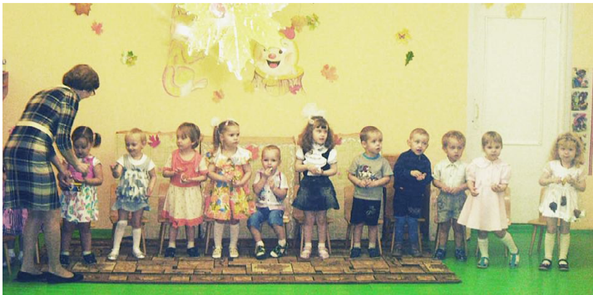
Дети получают угощение от Осени.

Мероприятия, посвященные разноцветной красавице Осени, прошли в детском саду № 1 "Сказка" села Сямжи. Первыми на празднике веселились самые маленькие воспитанники - дети первой младшей группы. Вместе с героями кукольного театра они совершили увлекательное путешествие. От птички узнали о