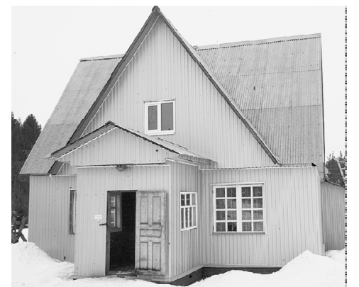
Новый магазин запчастей.