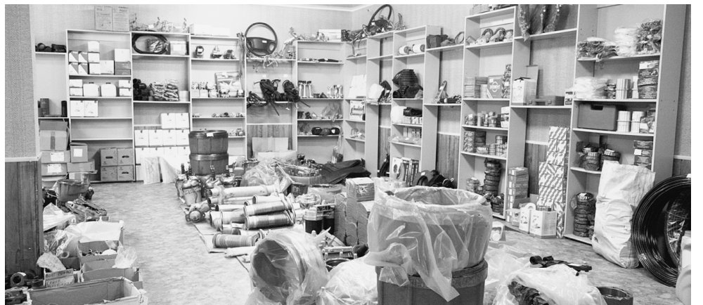
В торговом зале.