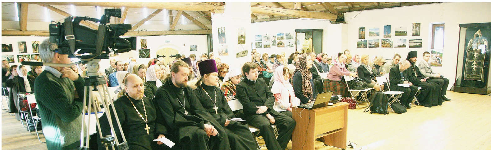
В зале заседаний во время XVII Димитриевских чтений.