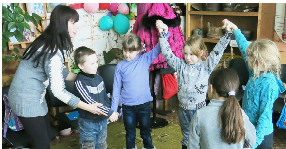
Во время занятия.

Материал подготовлен при поддержке Управления информационной политики Правительства Вологодской области.