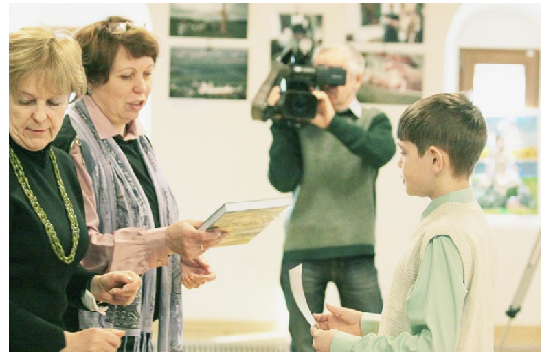
Наград удостоились и дети.