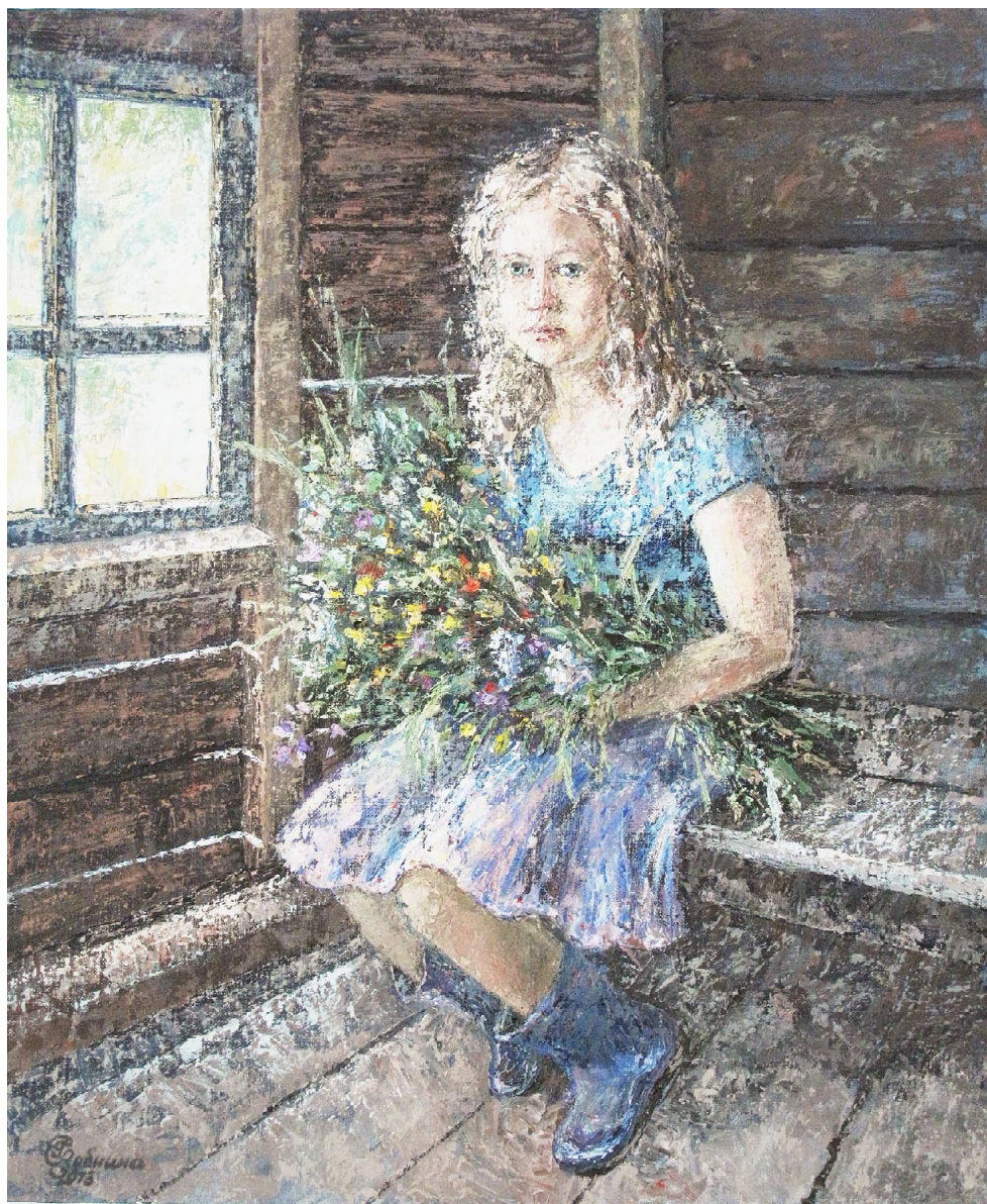
Репродукция работы Светланы Зобниной "Аришин букет".