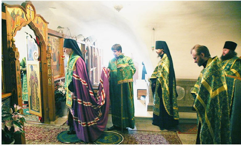
Молебен в нижнем Храме монастыря.

Уже в семнадцатый раз состоялись в Вологде образовательные Димитриевские чтения. Их проводят совместно Вологодская епархия, областной департамент образования, общественный совет "Согласие" и духовно-просветительский центр "Северная Фиваида".