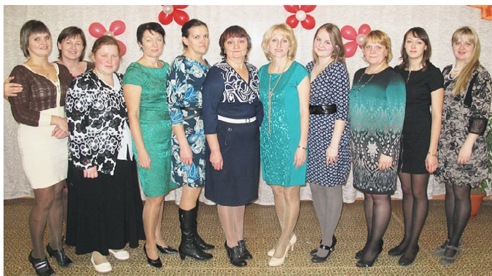
Коллектив педагогов Дома детского творчества.

ского творчества и в кружковых объединениях на базе общеобразовательных школ занимается 414 обучающихся.