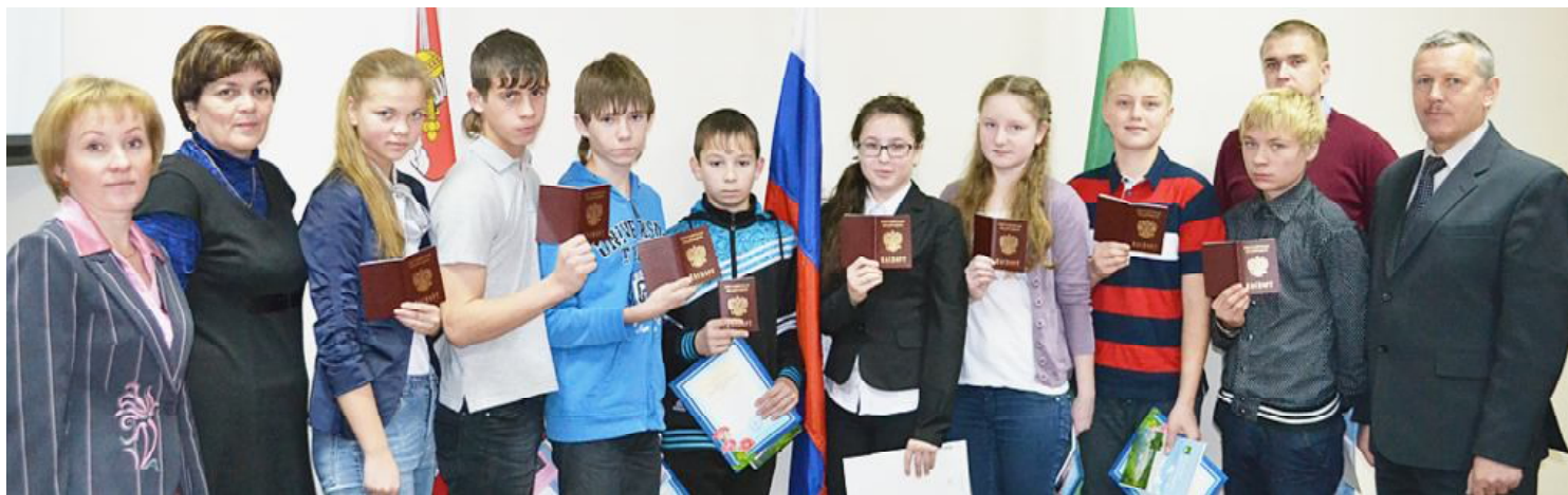
Фото на память.

Двенадцатого декабря в рамках празднования Дня Конституции в Сямже прошло традиционное мероприятие - вручение паспортов гражданам Российской Федерации.