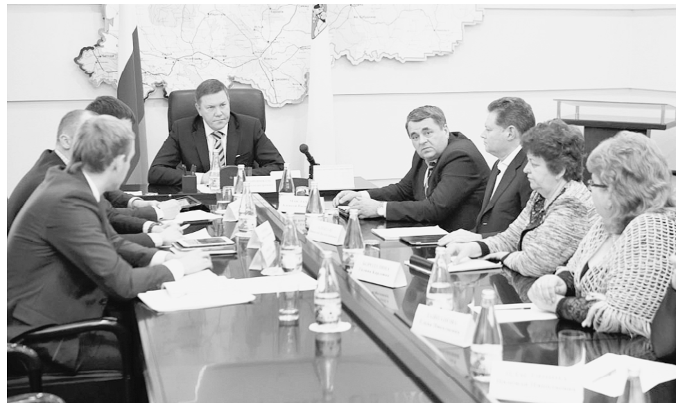
Во время встречи с директорами предприятий легкой промышленности.

"Экономический блок Правительства области будет активно работать над реализацией антикризисных мер для помощи предприятию "Вологодский текстиль". Мы объединим наши усилия с полномочным представителем Президента в СЗФО Владимиром Булавиным, главой Минпромторга Денисом Мантуровым для поддержки наших усилий по реструктуриза-