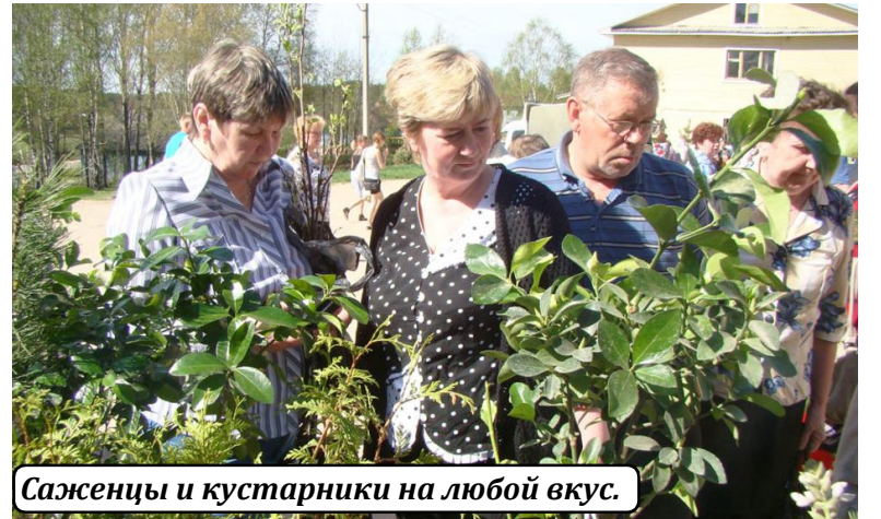
Саженцы и кустарники на любой вкус.