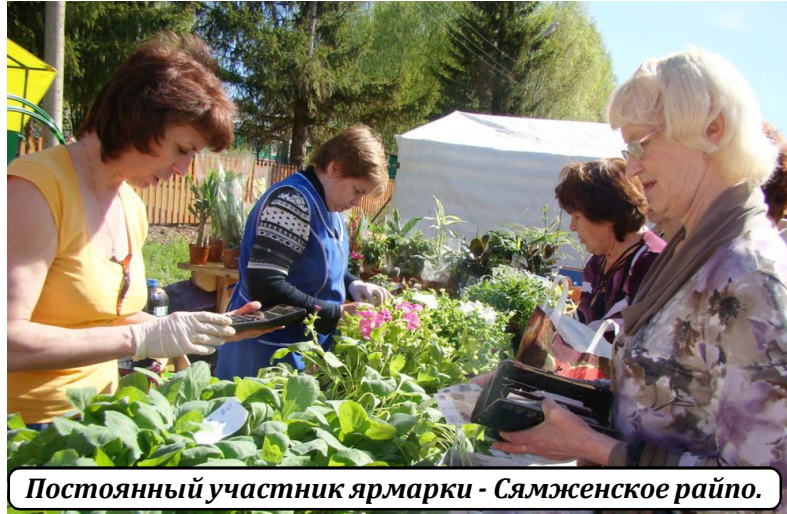
Постоянный участник ярмарки - Сямженское райпо.

Сельскохозяйственная ярмарка, прошедшая в минувшую субботу, собрала многочисленных покупателей. Здесь можно было увидеть не только жителей районного центра, но и сельских поселений. Поддержала и погода - день выдался солнечный и тёплый.