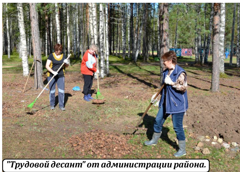
"Трудовой десант" от администрации района.

Детский оздоровительный центр "Солнечный" готовится к летнему сезону. Седьмого июня начнется первая летняя смена. Отдохнуть на лоне природы в экологически чистом