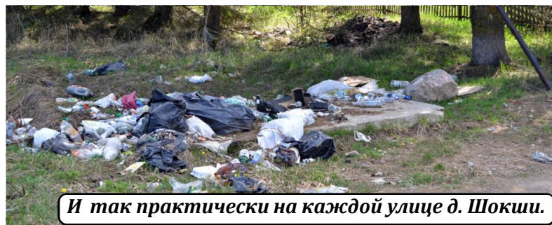
И так практически на каждой улице д. Шокши.