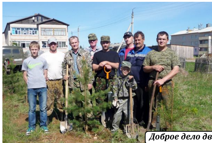
Доброе дело два века живёт.

Во всероссийский День посадки леса, прошедший 18 мая, не остались в стороне от этой акции и предприниматели нашего района.