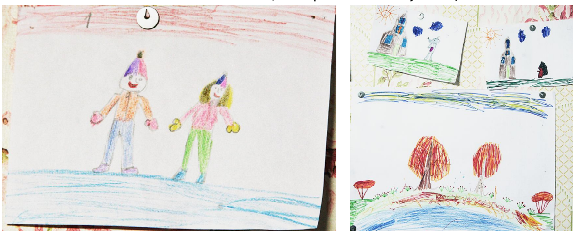
Папа и мама на катке - мечта Лены! Часть семейной выставки рисунков Лены Ореховой.

Андрей СМОЛЯКОВ, Алексей КОЛОСОВ. Фото авторов.