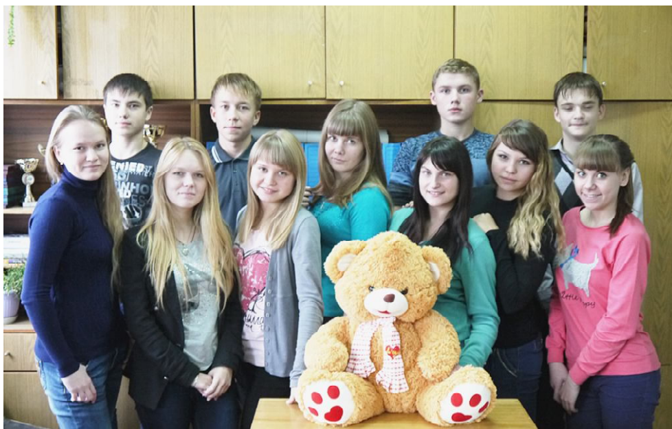
Команда КВН из Сямжи.

Своими впечатлениями о поездке поделились участницы сямженской команды "Тинэйджеры".