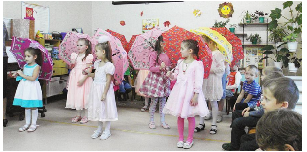
Малыши разучивают танцы.

Отшумела золотым листопадом осенняя пора. В конце октября в детском саду на всех возрастных группах прошли праздники, посвященные этому замечательному времени года. В гостях у ребятшек побывали веселые Сентябринка, Октябринка и Ноябринка, старичок Лесовичок, Леший, Подсолнушек и, конечно же, сама красавица Осень с подарками.