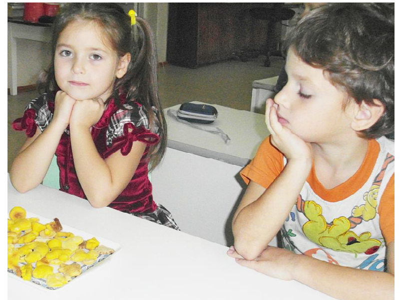
"Испекли мы печенье..."