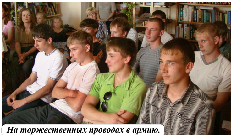
На торжественных проводях в армию.

Армейская школа - особая школа жизни. Здесь юноша получает бесценные уроки мужества, патриотизма, настоящей мужской дружбы. Хочется верить, что и у этих ребят после прохождения армейской школы, всё в жизни сложится удачно.