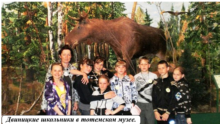
Двиницкие школьники в тотемском музее.

В городе Тотьме четвертого и пятого июня прошел шестой областной фестиваль детских экологических театров "Родная сторона".