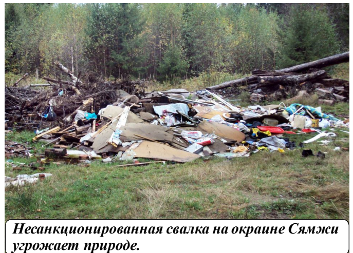
Несанкционированная свалка на окраине Сямжи угрожает природе.