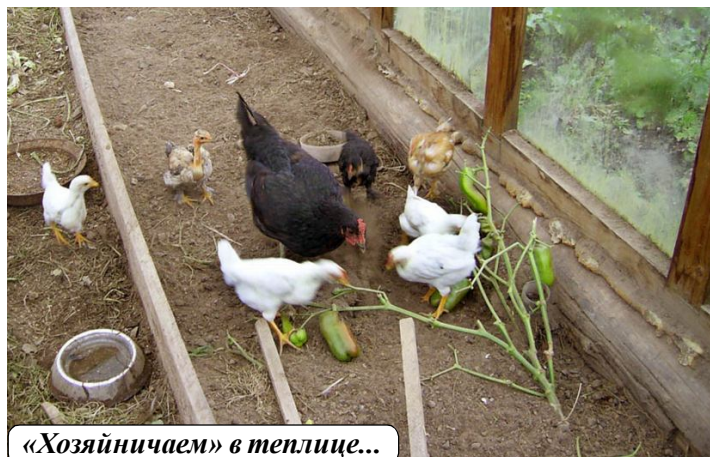
«Хозяйничаем» в теплице...