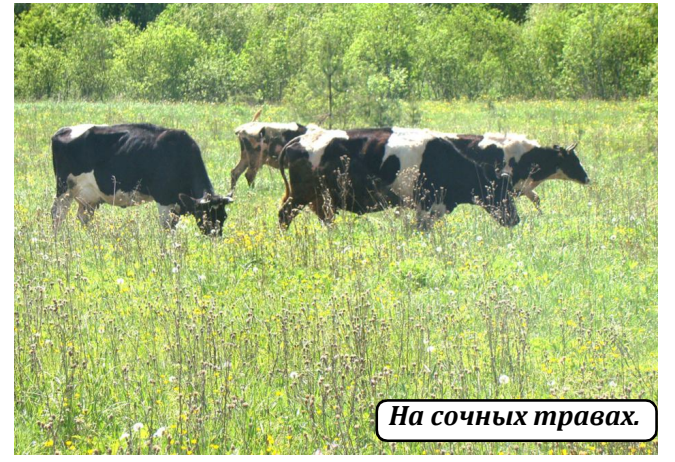
На сочных травах.