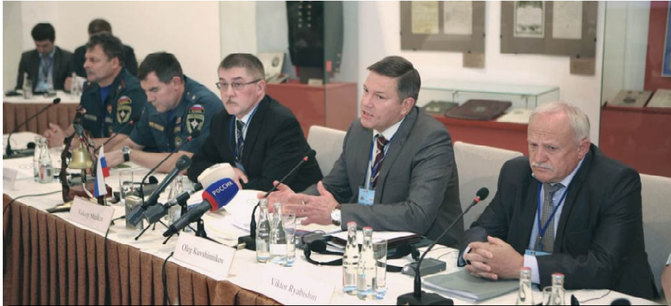
Участники встречи Генеральных директоров спасательных служб государств.

Совет государств Балтийского моря - межправительственная региональная организация, созданная в марте 1992 года в Копенгагене на конференции министров иностранных дел стран Балтийского моря. В составе Совета одиннадцать стран: Германия, Дания, Исландия, Латвия, Литва, Норвегия, Польша, Россия, Финляндия, Швеция, Эстония. Кроме того, членом СГБМ является Европейская комиссия.