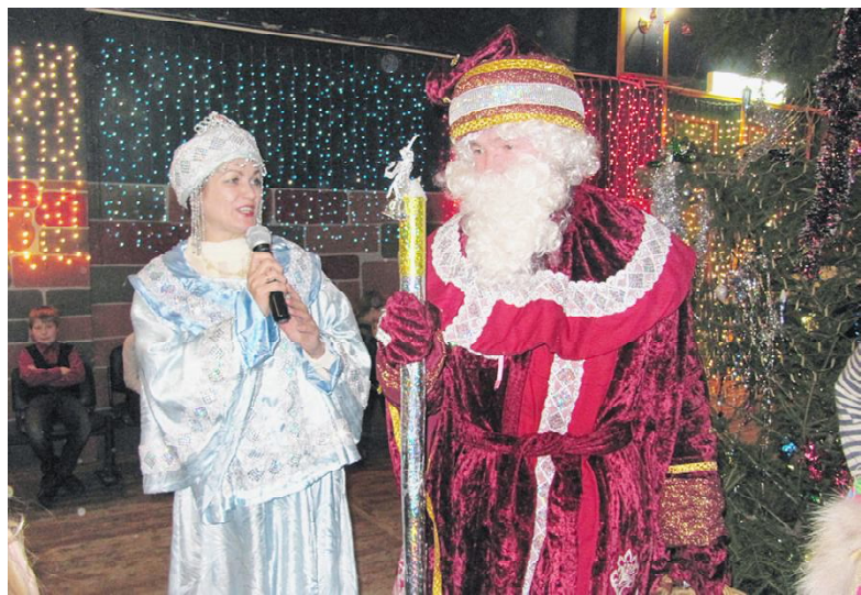
Новогодние встречи для детей.