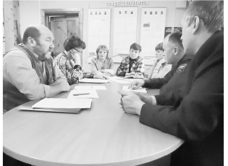
Идёт заседание комиссии.