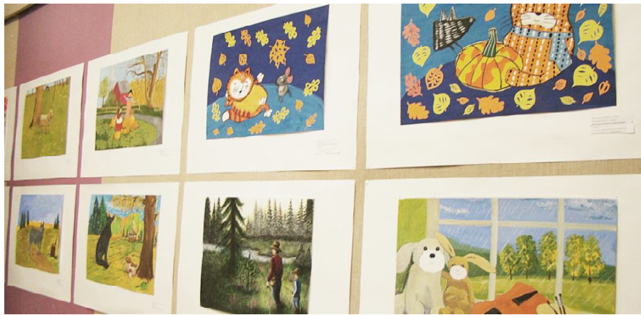
Работы юных художников полны ярких красок.