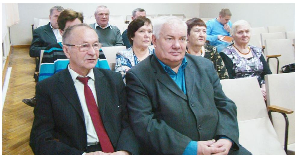
Во время заседания.