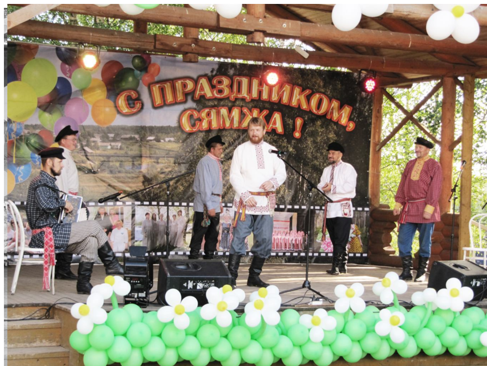
Ансамбль "Вагане" из Верховажья.

Как вы думаете, что может собрать вместе людей разных профессий, увлечений и интересов? Что может заставить хотя бы на время забыть о работе и суете? Я думаю, что многие со мной согласятся - это любимый праздник всех жителей Сямжи - День рождения родного села и Бельтяевская ярмарка!