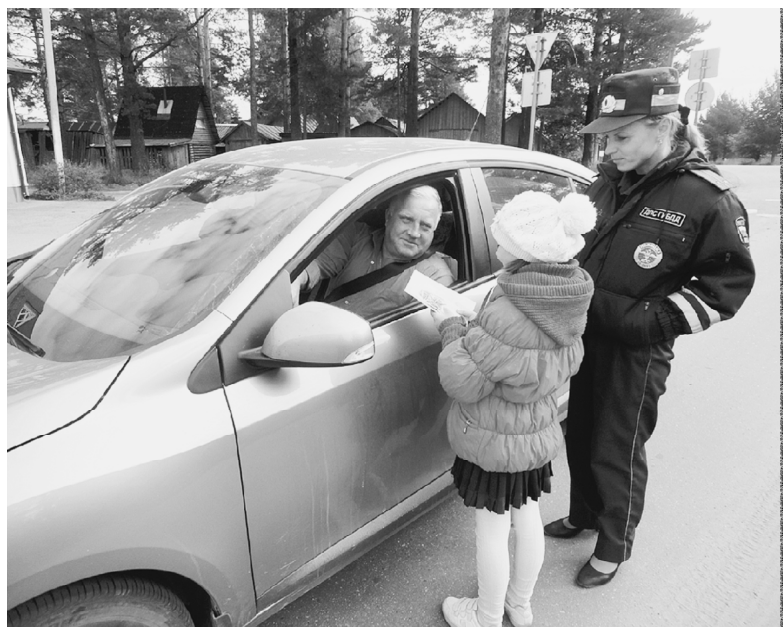
Соблюдать правила дорожного движения - важно!