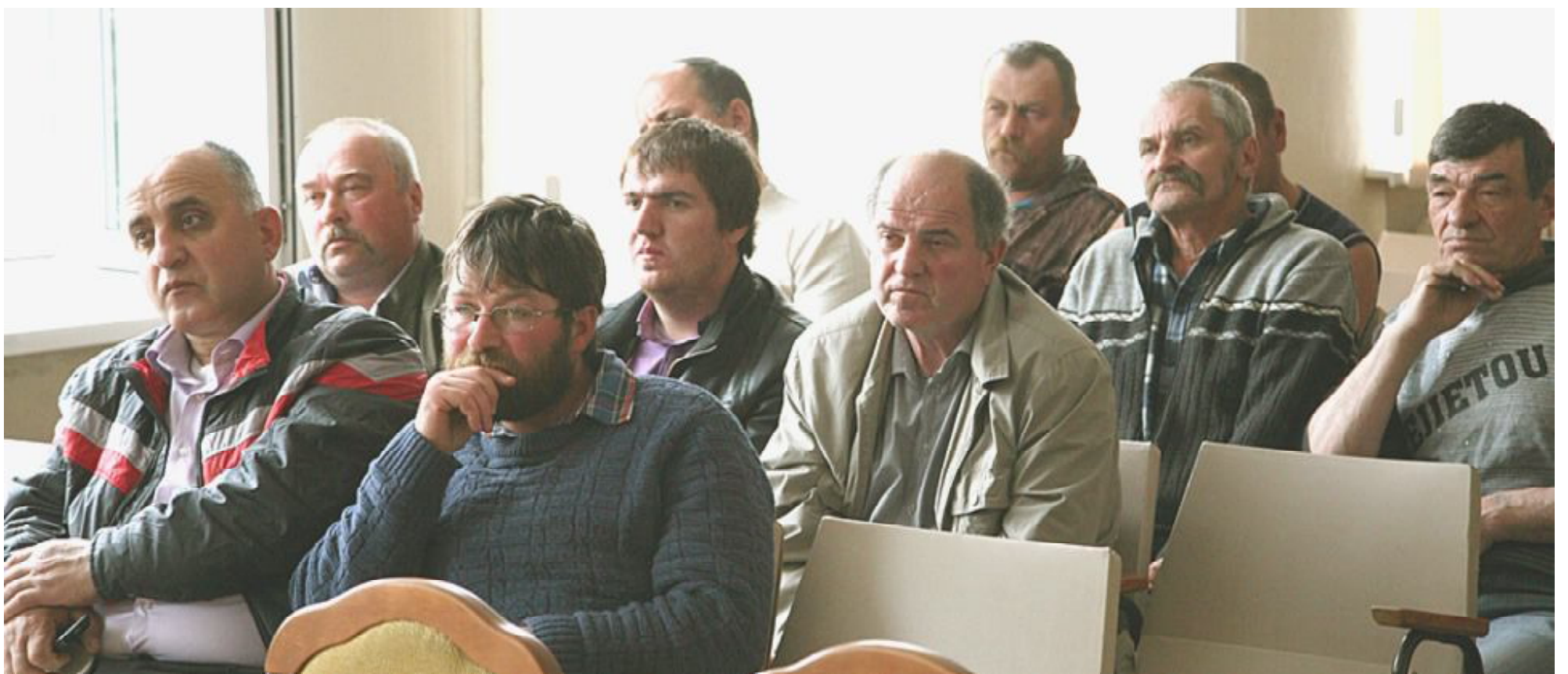
У каждого из них своя история, но их трудности словно «под копирку» выписаны.

У сямженских фермеров конкурентов в виде крупных агрокомплексов и далеко за горизонтом не наблюдает. Так сложилось. А много ли таких