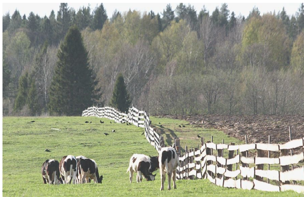
На родной земле.