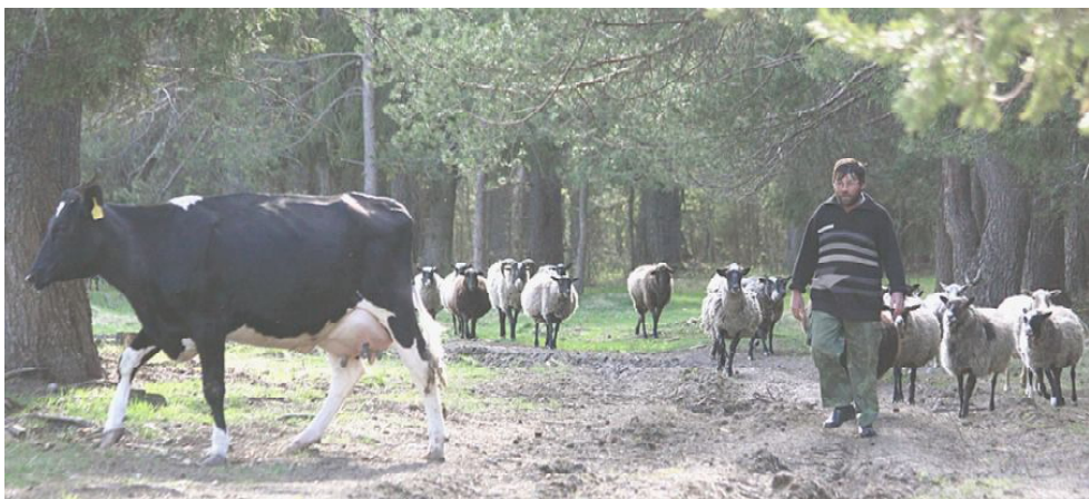
Домой с пастбища.