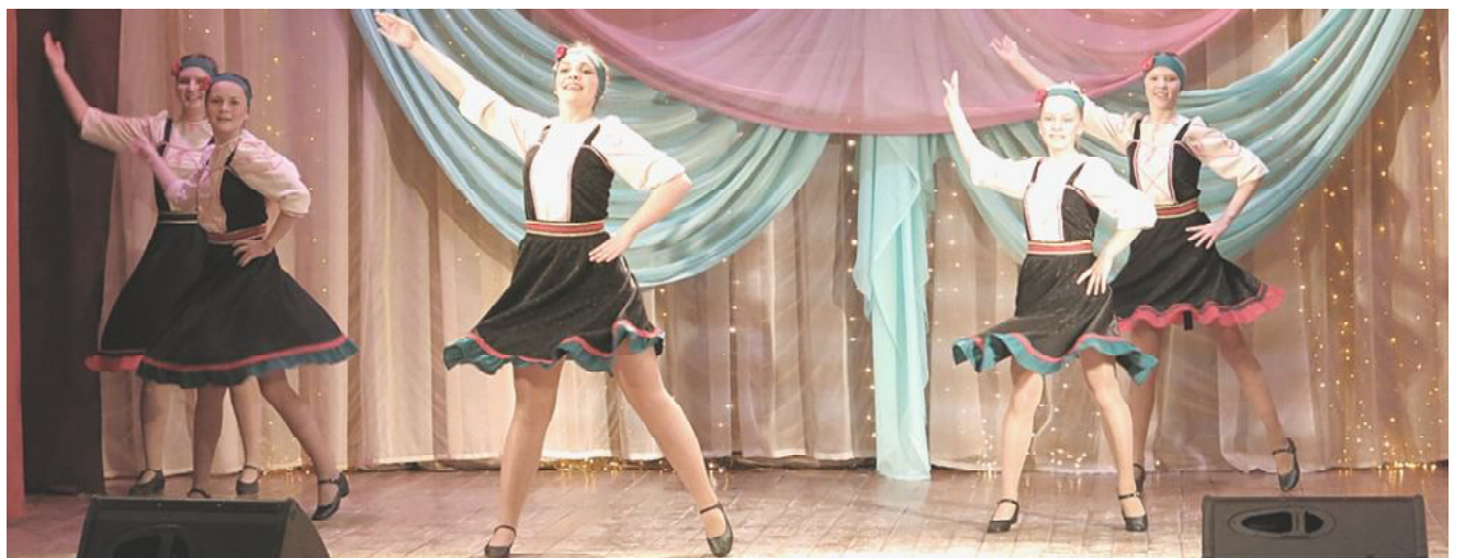
Выпускницы 2014 года - учащиеся 7 класса хореографического отделения.