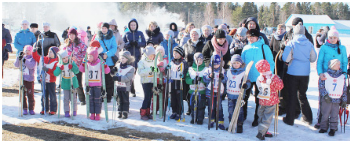
Участники детской спартакиады.