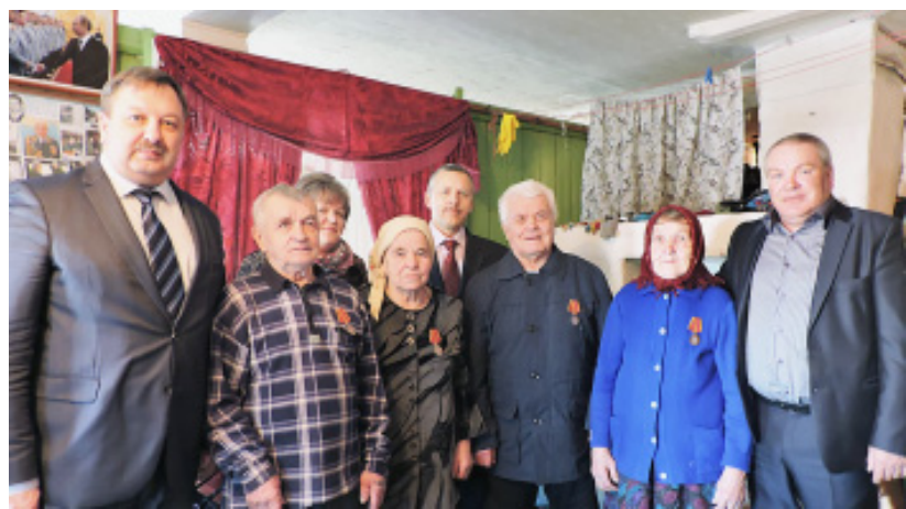
В гостях у ветеранов деревни Аверинской.