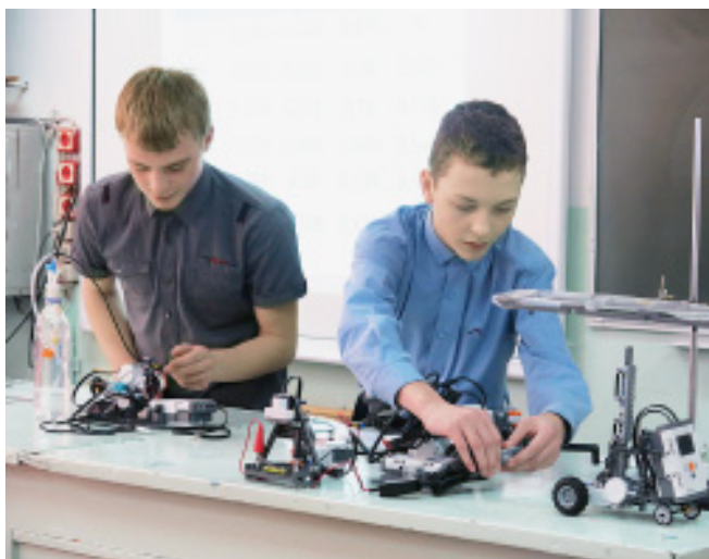
Мастер-класс «Первые шаги в робототехнику».