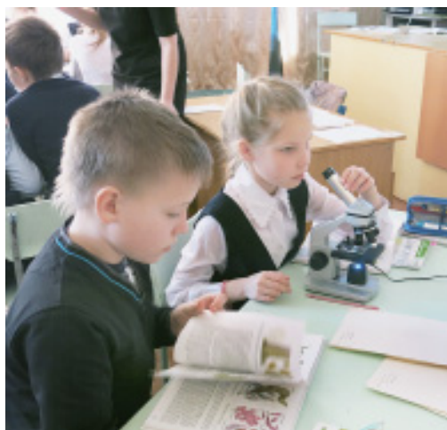
Тема урока «Одноклеточные водоросли».