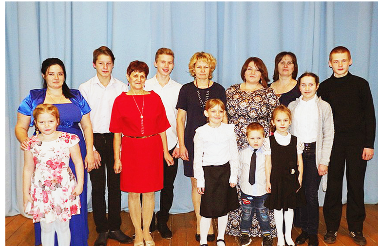
Участники праздничного концерта.