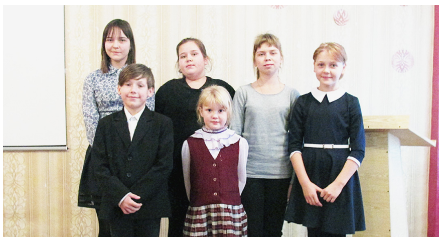
Победители конкурса чтецов.