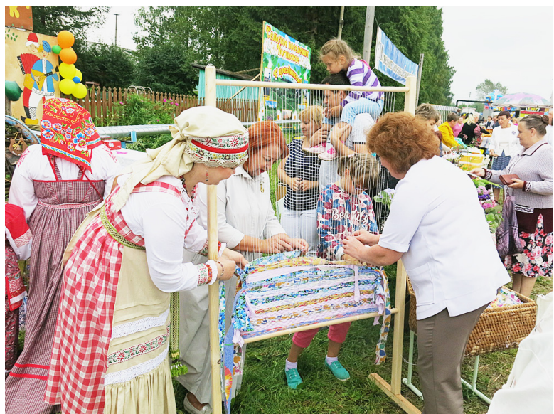
Желающие могли попробовать себя в плетении "Бельяевского коврика дружбы".