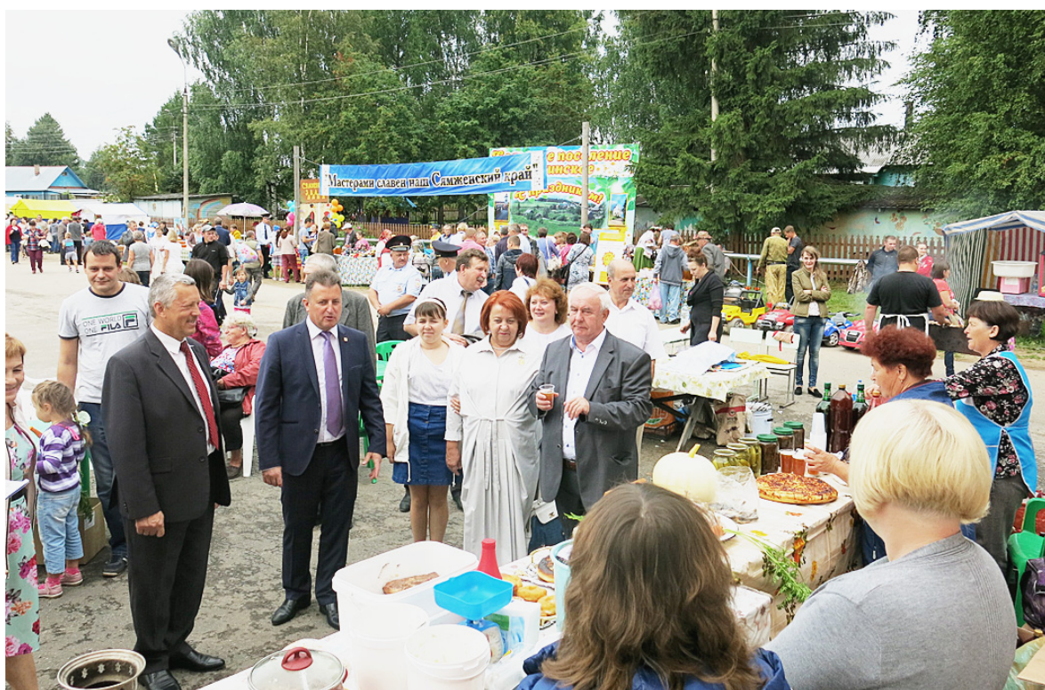
"Подходи, народ честной, в нашем поселении пир горой".

В этот праздничный день было много гостей, небезразличных к судьбе нашего края. Так, заместитель Губернатора Вологодской области Евгений Богомазов пожелал сямженцам дальнейшего процветания, обратил внимание на плюсы, которые характеризуют район, как успешно развивающийся, где можно жить, работать и строить планы на будущее. Благодарственным письмом Губернатора Вологодской