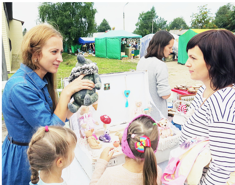
Удивительные вещи могут делать руки местных мастериц.