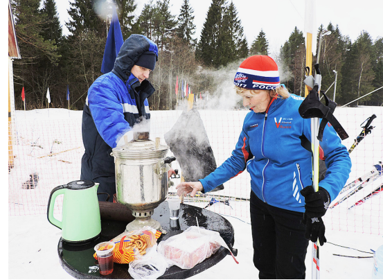
Горячий чай с сухарями согревал и лыжников, и болельщиков.