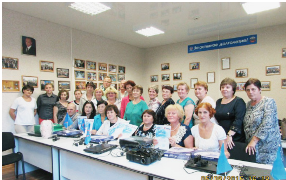
Участники областного этапа чемпионата.