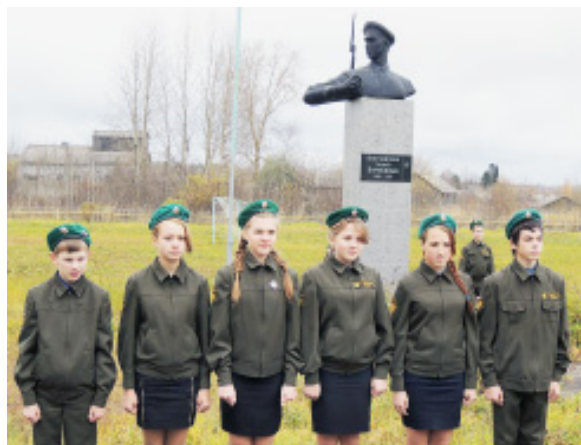
Ребята из отряда «Юный друг пограничника».