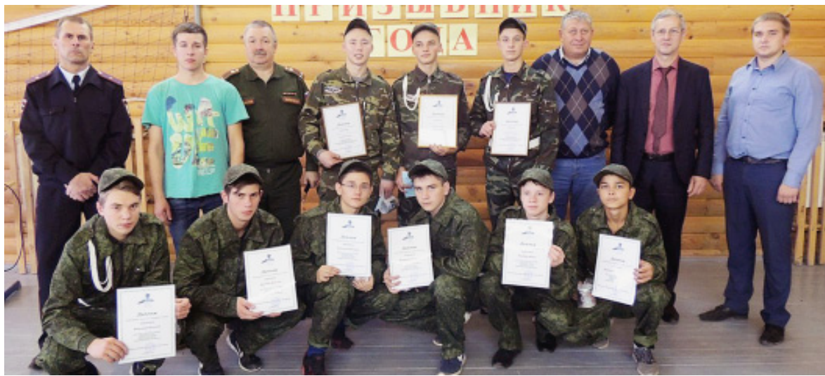
«Призывники года» и организаторы конкурса.