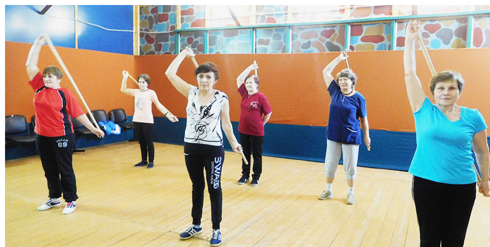
В здоровом теле - здоровый дух.

грамма включает в себя элементы лечебной гимнастики. Упражнения демонстрируются на экране под музыкальное сопровождение, а мы повторяем. Комплекс регулярно обновляется, упражнения меняются. Занятие начинается с разминки, которая даёт позитивный настрой. Затем - упражнения с гимнастическими палками, направленные на укрепление мышц шеи и плечевых суставов, с мячами - для упругости рук. Заканчива-