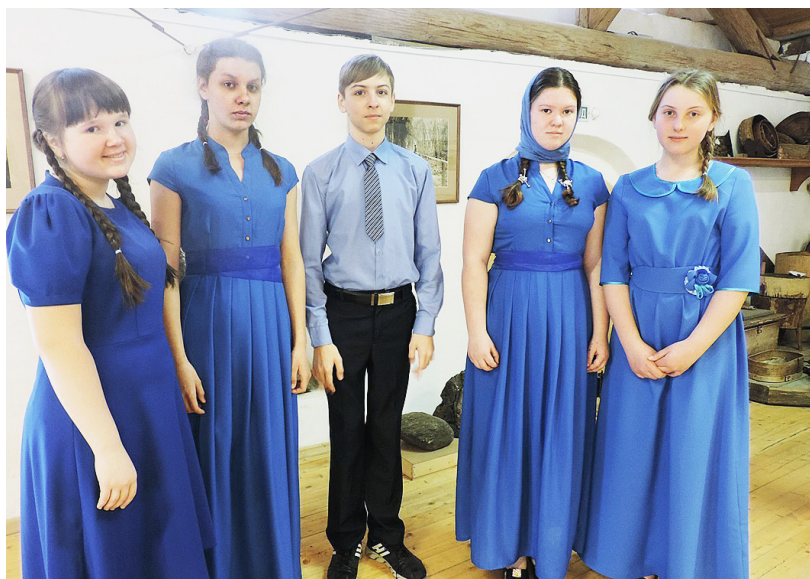
Вокальная группа "Арт-Экспромт".

В Вологде, в Спасо-Прилуцком Димитриевом мужском монастыре, 28 марта состоялись XVIII Малые Димитриевские чтения. Тема мероприятия: "Носители и хранители православия на Вологодчине (1917-2017)".