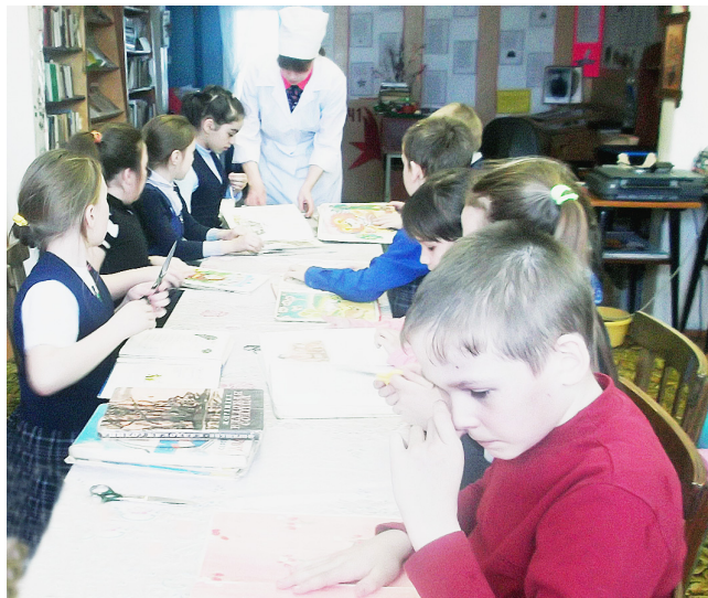
Участники кружка "Книголюб" побывали в "Книжкиной больнице" и "вылечили" 24 книги.

"Неделя детской книги" стала уже традиционным мероприятием нашей библиотеки. В этом году она проходила с двадцать третьего по тридцать первое марта совместно с Режской школой.