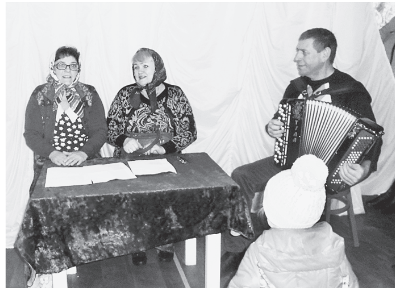
Юмористические сценки вызвали дружный смех и громкие аплодисменты.

В посёлке, где давно уже не работает дом культуры, встреча с самодеятельными артистами стала настоящим праздником. В исполнении ансамбля "Ивушка" и солистов коллектива прозвуча-