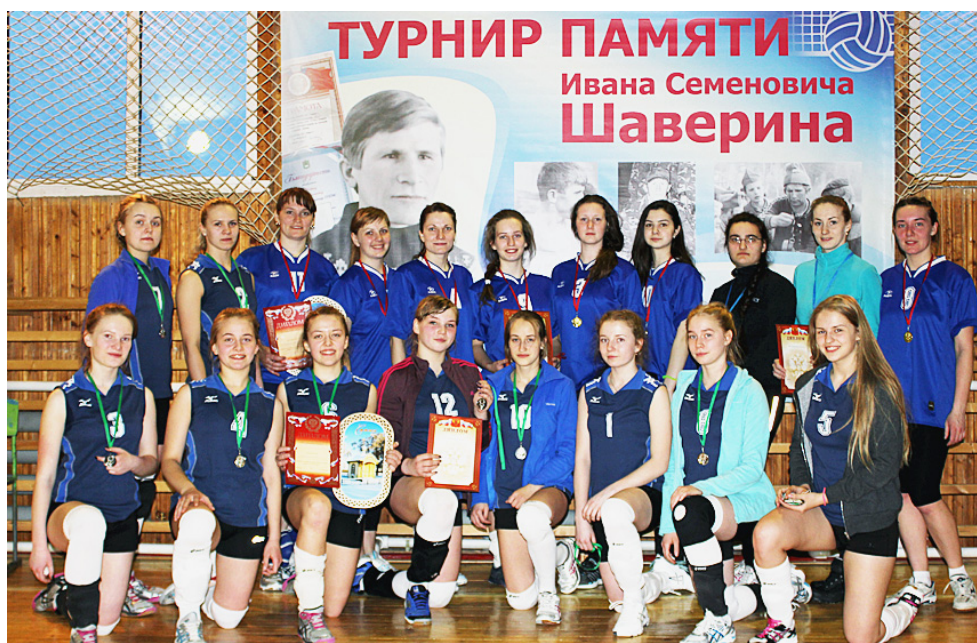
Сильнейшие команды турнира.