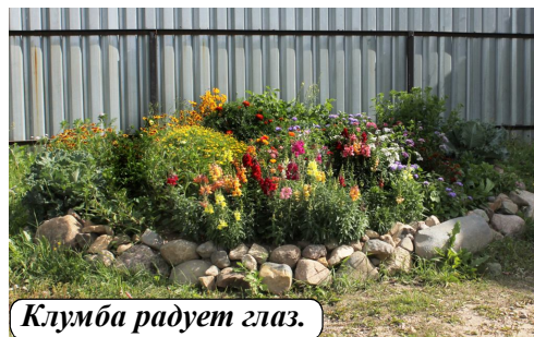
Клумба радует глаз.