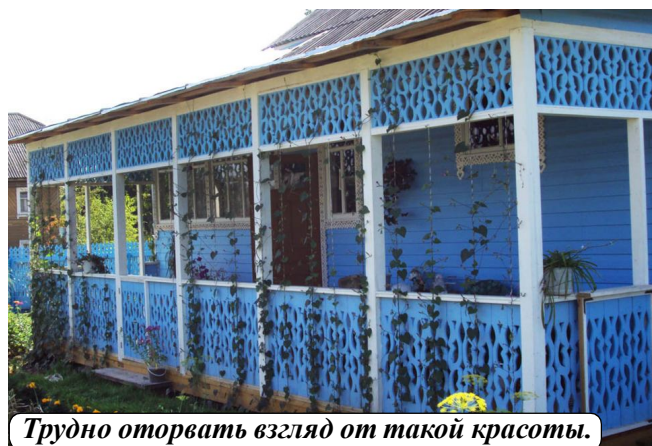
Трудно оторвать взгляд от такой красоты.