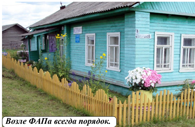
Возле ФАПа всегда порядок.