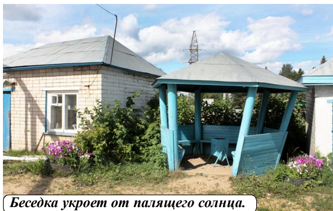
Беседка укроет от палящего солнца.

бимых цветов - все они были посажены. Больше всех за клумбой ухаживает сторож Галина Александровна Ершова. Татьяна МОРОЗОВА. Фото автора.