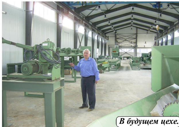
В будущем цехе.

Так, на территории смонтированы добротные, просторные и большие