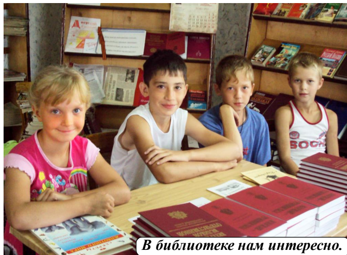
В библиотеке нам интересно.