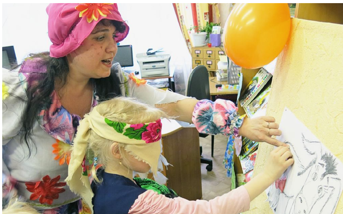
Конкурс «Прицепи хвост Иа».