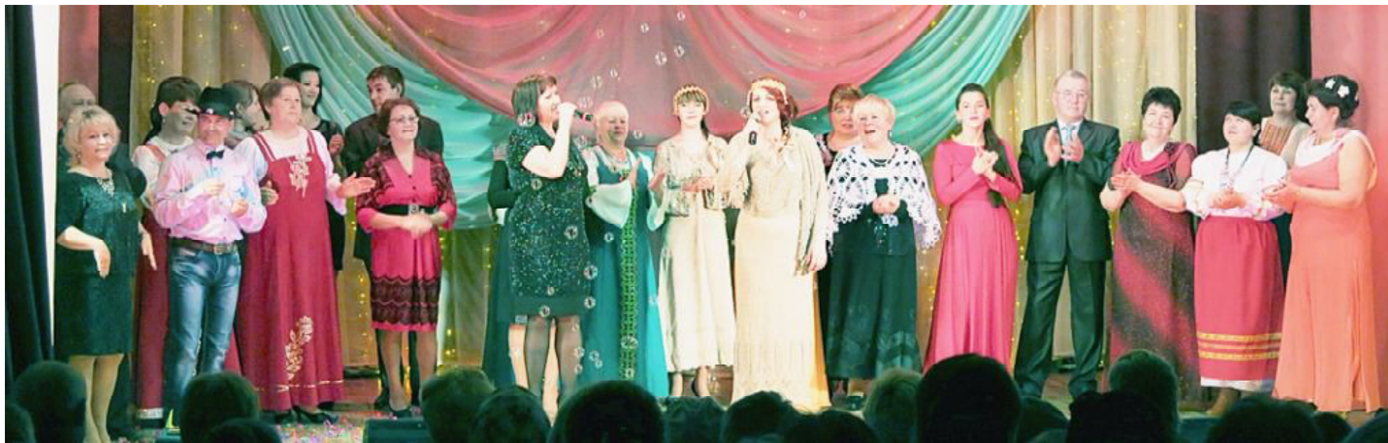
Участники фестиваля «Споём вдвоём».

Подробный фотоотчёт с фестиваля размещён на официальном сайте газеты "Восход".