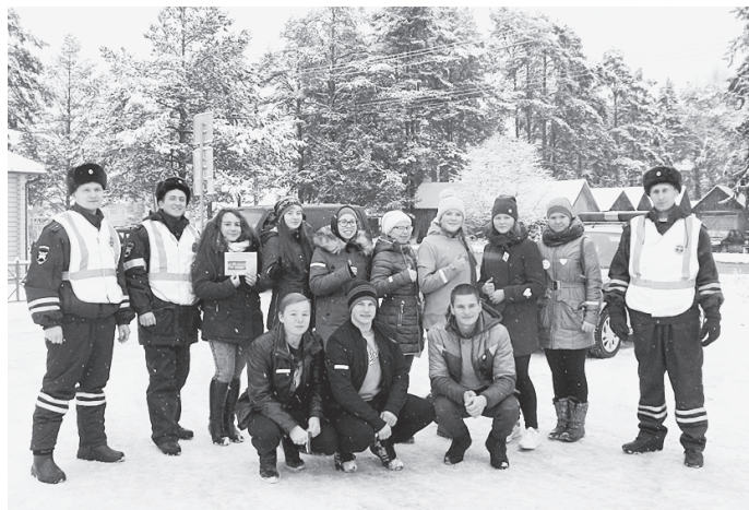
ОГИБДД по Сямженскому району.

В ходе проведения акции юные инспекторы движения демонстрировали прохожим световозвращающие элементы: полоски, брелоки, браслеты и рассказывали о необходимости их использования в темное время суток, а также в условиях плохой видимости. Оказалось, что все пешеходы знают, для чего нужны световозвращатели, но мало у кого они имелись. Поэтому всем участникам акции сотрудники Госавтоинспекции дарили световозвращающие наклейки и призывали пешеходов к неукоснительному соблюдению Правил дорожного движения!