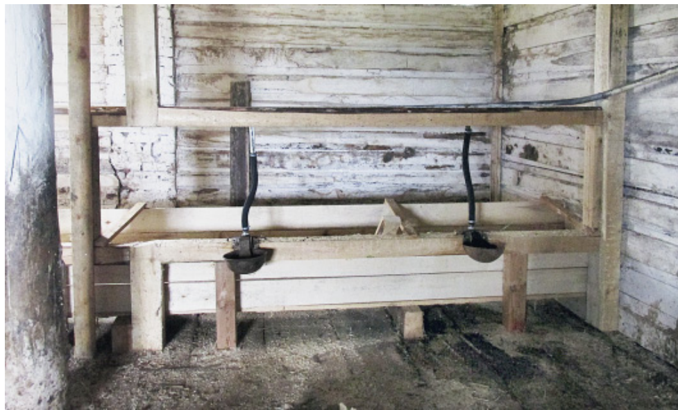
Новые клетки для скота.