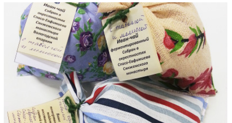
Вкусен и полезен чай из иван-чая.

Татьяна МОРОЗОВА.