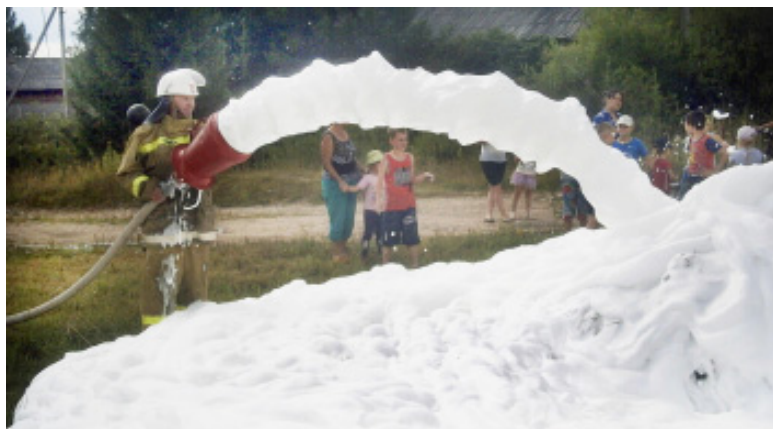
Особый интерес у гостей вызвала пенная атака.

необходимое оборудование, регулярно проводятся учения. Пожарные на практике показали свою работу: технику тушения пожара. Живой интерес, особенно у детей, вызвала пенная атака на предполагаемый объект