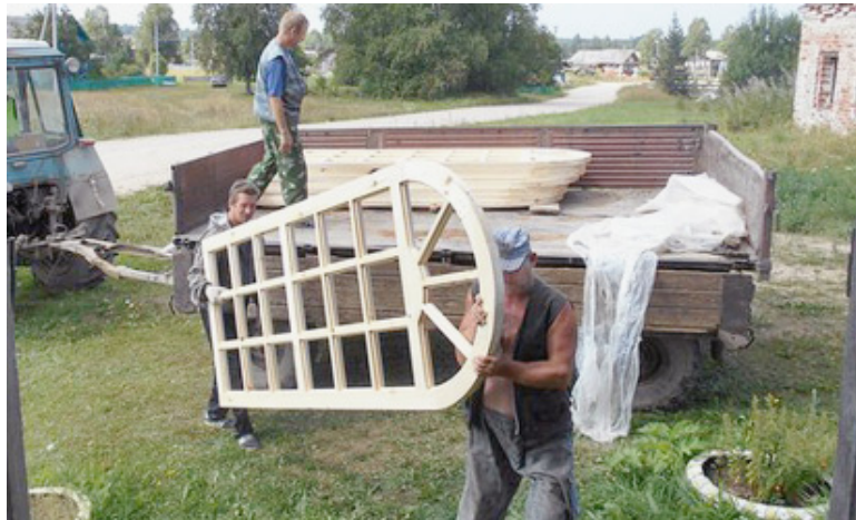
Новые рамы украсят башню центрального купола.