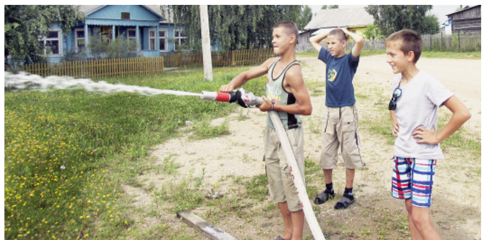
Мальчишки пытаются сбить мяч.