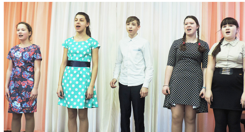
Учащиеся вокального класса детской школы искусств.

Светлана СИГАЛЁВА.