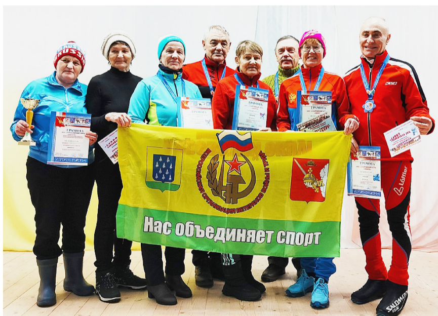
Команда сямженских ветеранов.