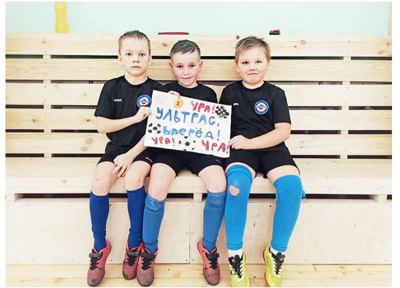
Наши юные футболисты успевали и играть, и поддерживать товарищей.

Дмитрий СМЕРНОВ.