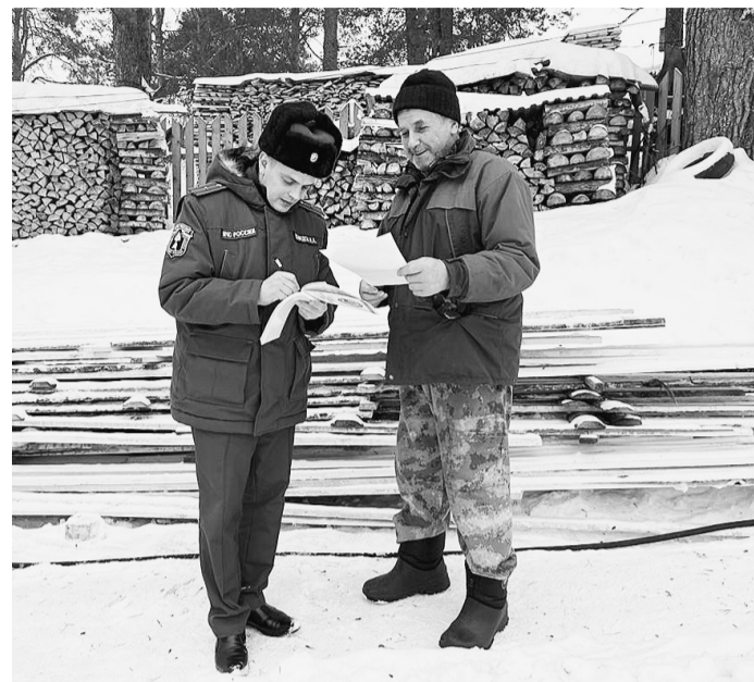
В ходе рейдов гражданам напомнили о необходимости соблюдения требований пожарной безопасности в быту.

Отдел надзорной деятельности и профилактической работы по Сямженскому и Верховажскому районам.