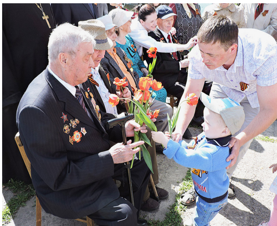
На митинге 9 Мая ветераны всегда самые важные гости. Это их праздник.

Дмитрий СМЕРНОВ.