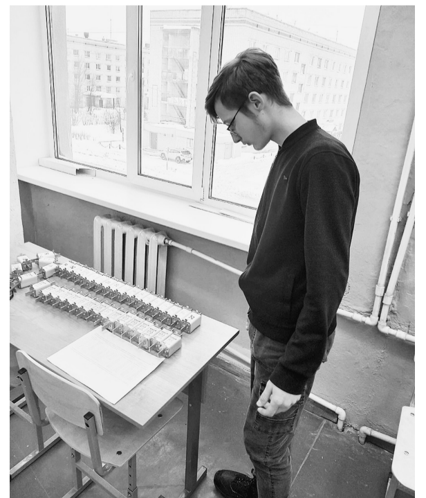
Правильный выбор профессии — это важно.

Подготовила Анастасия СОКОЛОВА.