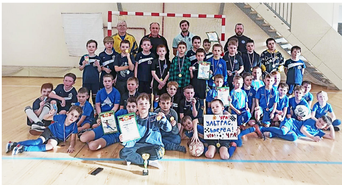
С помощью таких мини-турниров ребята получают необходимый для будущих свершений опыт.