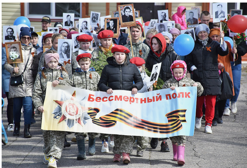
Ежегодно в День Победы жители сел и деревень Сямженского округа участвуют в акции «Бессмертный полк».