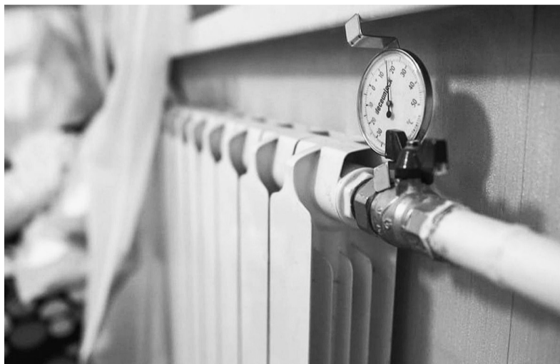
В настоящее время в субъектах округа созданы необходимые резервы финансовых и материальных ресурсов для устранения возможных аварий.

Полномочный представитель Президента оценил результаты Вологодской области в получении муници-