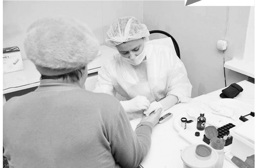
За последние девять лет региональный «кадровый улов» составил 304 медика, из них 245 врачей и 59 фельдшеров, акушеров и медсестер.

Поддержит область молодежь и сразу после трудоустройства: в течение трех лет начинающие специалисты на скорой помощи будут получать ежемесячную выплату: врачи – по