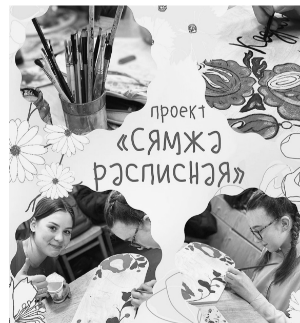
В создании проекта принимают участие не только члены волонтерского отряда, но и их родители, и педагоги.

Сейчас во всех районах области идет активная поддержка своих финалистов. Надеемся, что и сямженцы не останутся в стороне и отдадут свой голос за инициативных земляков. Это сделать довольно просто: нужно зарегистрироваться на сайте: dobro.ru , после чего найти на главной странице (прокрутив колесико компьютерной мыши чуть вниз) раздел «Народное голосование Международной премии #МЫВМЕСТЕ», затем вписать в графу «Что ищете?» (проект, автор) – назва-