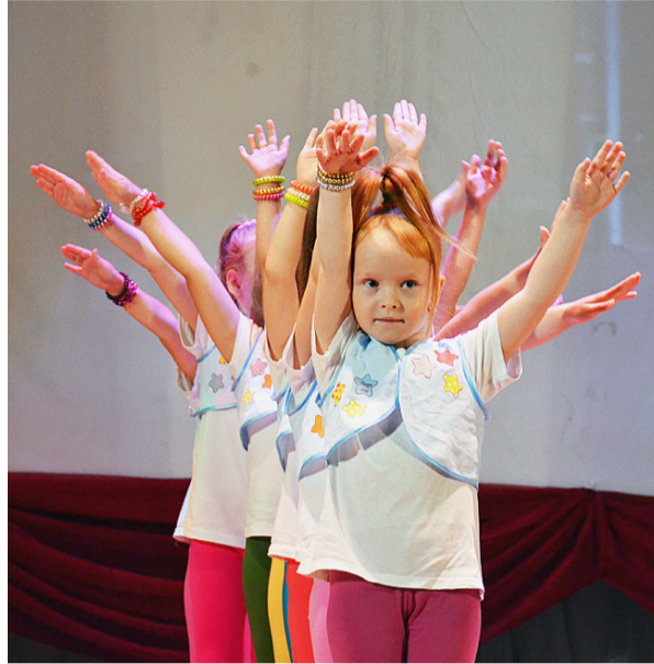
Подрастающее поколение артистов.

Можно с уверенностью сказать, что равнодушных зри-