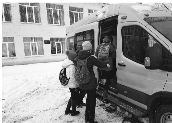
Органы управления образованием должны обеспечить подвоз «школьными автобусами» детей, проживающих от образовательных организаций (школ и детских садов) на расстоянии свыше 1 км.

В связи с указанными обстоятельствами прокуратура Сямженского района обратилась в суд с иском о возложении на Управление образования Сямженского муни-