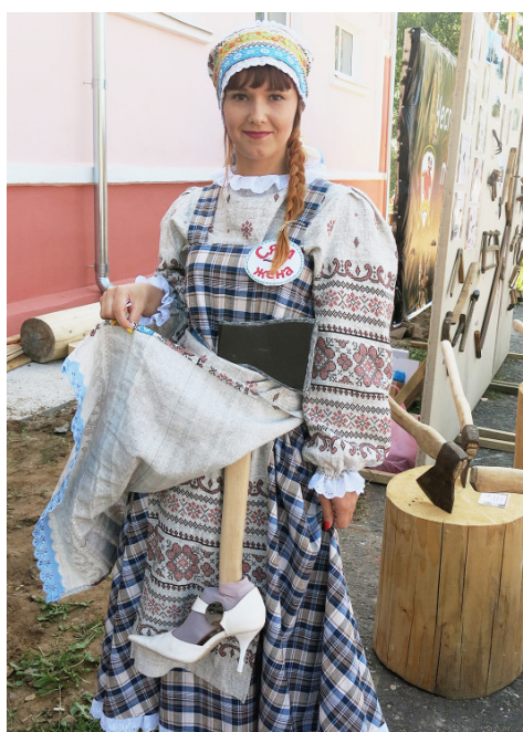
С таким топоричем и в пир, и в мир.