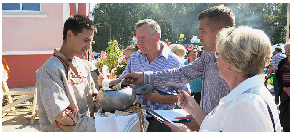
Ах, и хороша каша из топора!