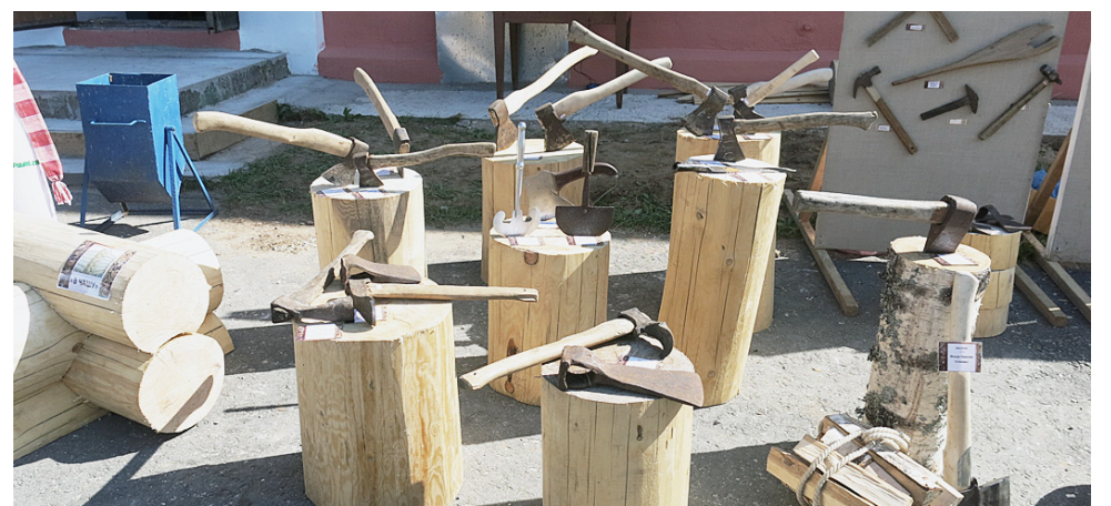
На выставке были представлены разнообразные виды топоров - всего более 30 экспонатов.