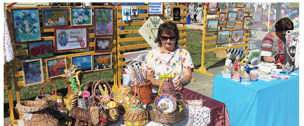
Сямженский район на «Аллее мастеров» представляли семь участников и два учреждения.

На площади у РЦК краеведческий музей представил выставку с одноименным названием. Здесь были представлены раз-