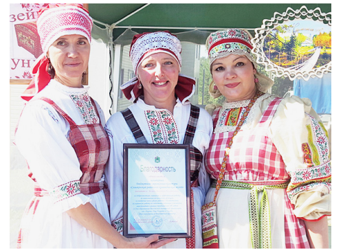
Коллектив краеведческого музея.

Долго еще гуляла Сямжа, а ярким завершением праздника стали красочный фейерверк и дискотека.