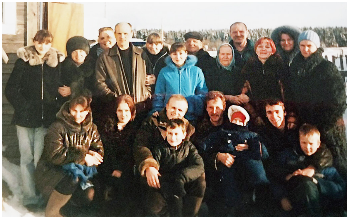
У Гани Африкановны 13 детей, 23 внука и 15 правнуков.

Екатерина ТИХОМИРОВА.