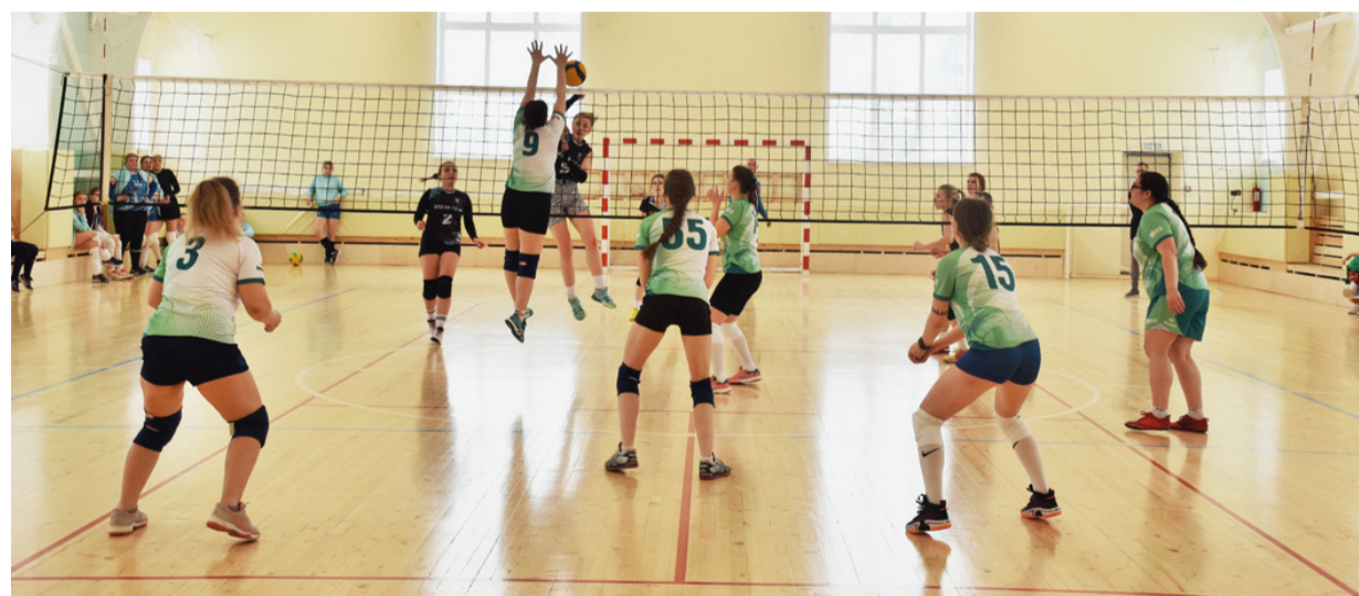
На групповом этапе сямженские девушки (в светлом) смогли обыграть соперниц из Вельска.