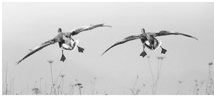
Сроки охоты в весенний период важно соблюдать.

К печати подготовила Ирина МАКАРОВА.