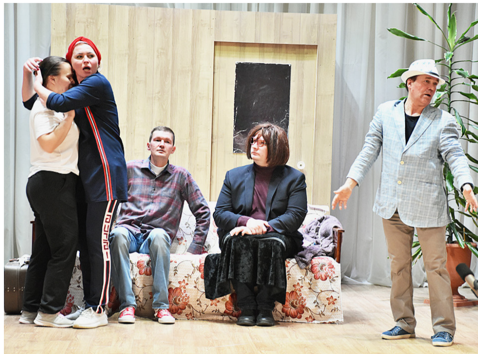
Непросто найти мужа для любимой дочери.

Обо всех рассказали, но по традиции хочется узнать, какой стала премьера для дебютанта Народного театра. «Если честно, то никогда бы не подумала, что буду играть в спектакле. Но, когда ходила на премьеры, всегда