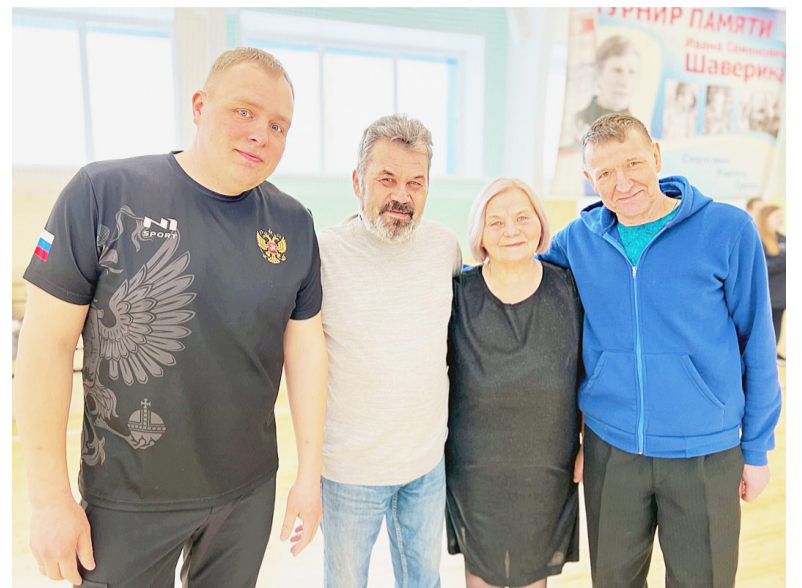
Почетные гости и организаторы спортивного мероприятия.

году. Когда стала известна дата турнира (1 апреля), мы собрали команду в слегка обновленном составе и выдвинулись в Сямжу. Дорога хорошая, ФОК отличный, с недавно выполненным ремонтом. Так получилось, что у нас был ограниченный состав, ровно 6 человек, но мы бились до победного, и нам удалось в итоге стать первыми. Домой ехали уставшие, но довольные. Уровень команд был в целом неплох. Нам попалась сильная группа, ведь в нее попали все три Вологодские команды. Тем не менее мы справились с поставленной задачей. Также хочется отметить, что очень захватывающим был матч за 3 место, в котором сямженские девушки уступили Вельску. Кстати, у Сямжи вообще замечательные команды, что женская, что мужская – цепкие, играют до последнего мяча, очень сыгранные коллективы хорошего уровня. Организация турнира также была на высоте: нас накормили бесплатным