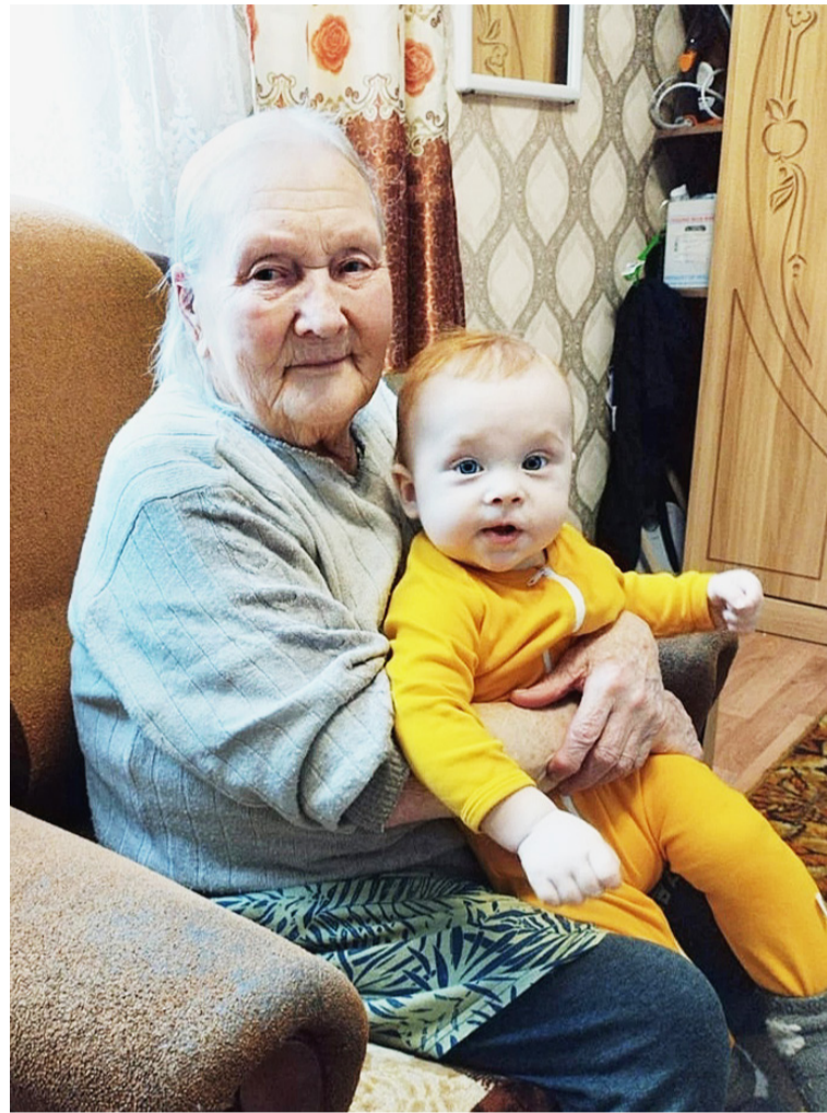
Счастливая прабабушка с самым младшим правнуком.