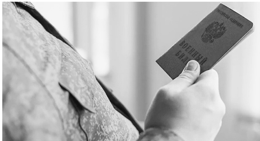
Все подробности о порядке получения основных медицинских и социальных услуг участниками СВО будут собраны в специальном буклете. Его будут выдавать при обращении в органы власти и социальные организации.

«Участникам СВО, признанными негодными для прохождения дальнейшей военной службы в связи с ранением или заболеванием, будет оказано содействие