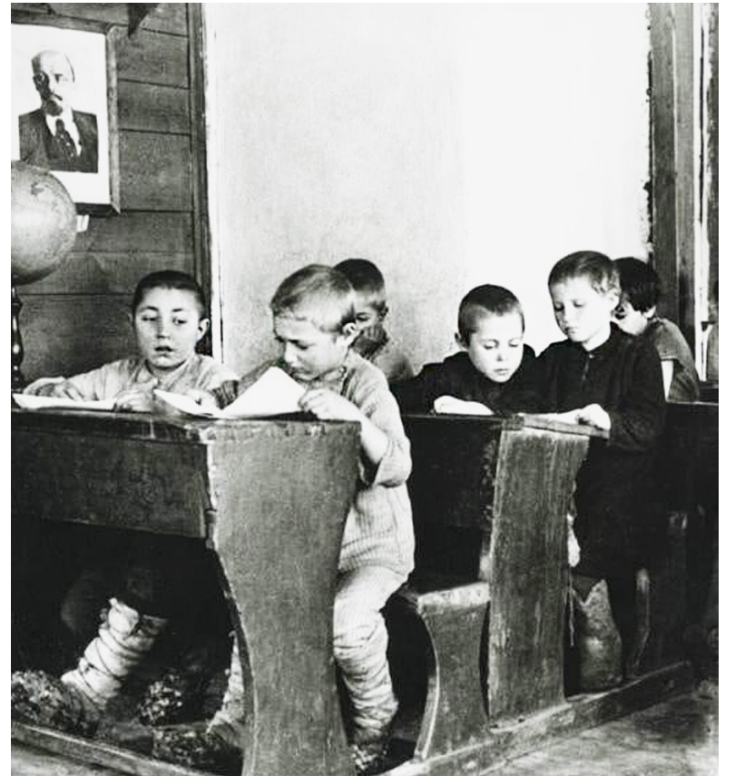
В начале века в школе изучались: родной язык, история, арифметика, геометрия, география, родное родство, природоведение, обществоведение и рисование.

1937 год. В августе приказом Сямженского роно на основании решения президиума Сямженского райисполкома средняя школа из Устьрецкого сельсовета переведена в тогда еще поселок Сямжу Бельтяевского сельсовета и названа Сямженская средняя школа.