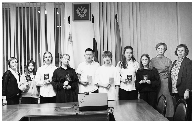
Во время вручения паспортов юным сямженцам.

Далее необходимо подготовить следующие документы: заявление о выдаче паспорта, письменное заявление, где вы изложите, когда и при каких обстоятельствах он был утерян, две личные фотографии (соответствующие определенным требованиям Административного регламента), документы для проставления