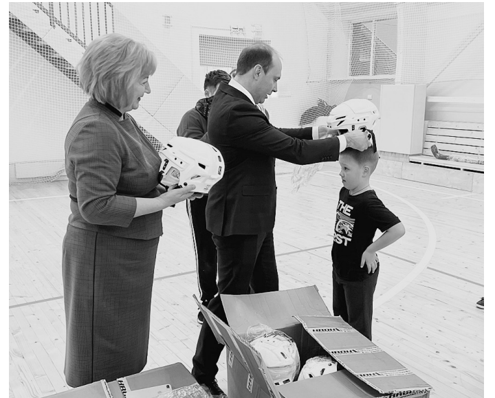
Примерка новой формы.