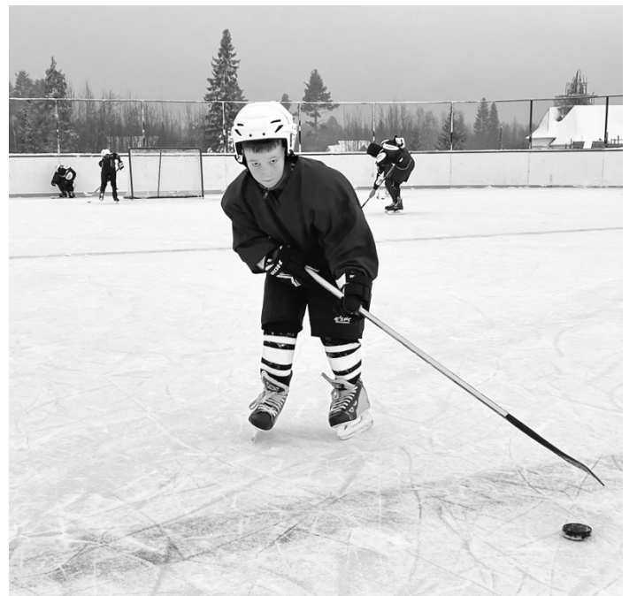
Ребятам сразу захотелось опробовать новую форму в деле...