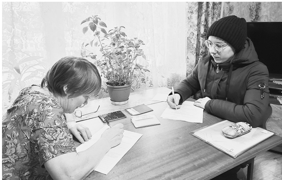
В течение 2022 года мобильной бригадой Комплексного центра Сямженского района совершено 310 плановых выездов, в ходе которых оказано 1240 социальных услуг 1200 гражданам. В текущем году в ходе 11 выездов обслужено 24 гражданина Сямженского округа.

На базе комплексных центров продолжено открытие служб социальной-реабилитационной помощи инвалидам, специалистами которых ведется индивидуальная работа с людьми по восстановлению навыков самообслуживания, например, после перенесенного инсульта, вовлечению молодых инвалидов в активную общественную жизнь. В прошлом году такие службы начали работать в Бабаевском, Бабушкинском, Белозерском, Вашкинском, Вожегодском, Тотемском округах. Благодаря их работе помощь специалистов по месту жительства получают более двух тысяч инвалидов.