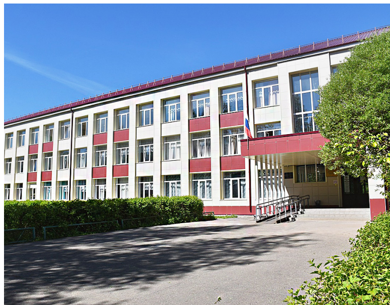
Сямженская средняя школа в наши дни.