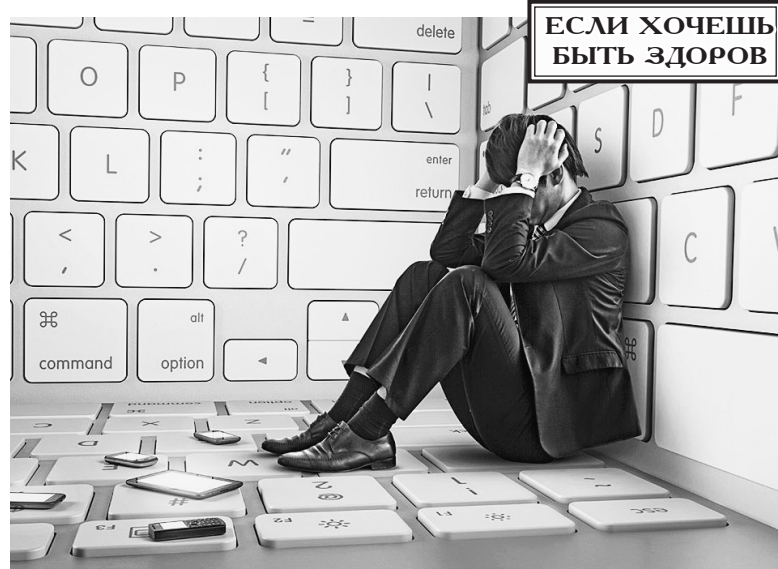
Интернет-зависимость характеризуется тем, что человек, постоянно использующий интернет, не способен контролировать себя и выйти из сети.

• потеря когнитивных способностей: с появлением интернета люди расслабились, потому что исчезла