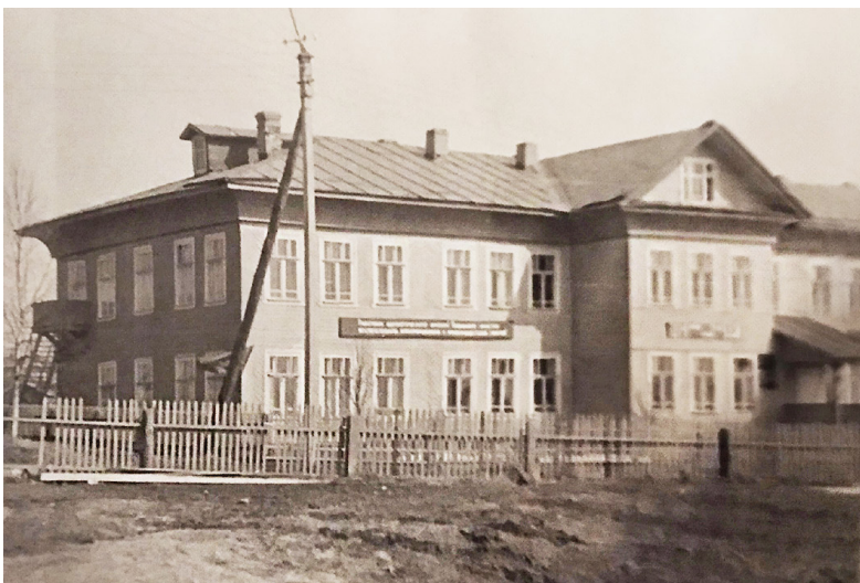
Сямженская неполная средняя школа.

1973 год. Именно в этом году 23 января образовательное учреждение переехало в новое здание, в котором,