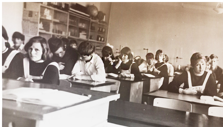
Первый урок физики в новой школе. 10 «а» класс. 1973 год.

В новой школе была кабинетная система, к которой мы долго привыкали. Если раньше учитель шел к нам, то здесь наоборот — мы шли в кабинет к учителю. После каждого урока класс сдавали дежурному, чтобы парты были чистые. Очень бережно относились к мебели. После уроков дежурные мыли доску, обтирали парты, подоконники и мыли пол. Наш класс был очень дружный: все вместе ходили в походы, готовили концерты, проводили классные и общешкольные вечера, рисовали стенгазеты к праздникам. Очень интересно проходила игра «Зарница». Также мы оказывали помощь колхозам в уборке льна. И сейчас стараемся сохранить нашу школьную дружбу, собираясь вместе в юбилейные даты и вспоминая чудесные школьные годы. С глубоким уважением мы вспоминаем