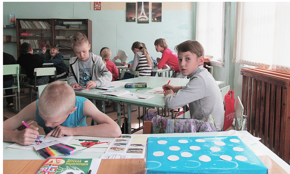
Занятия по интересам.

Первого июня в посёлке Гремячий начал работу пришкольный лагерь для 20 детей. Воспитательная работа в лагере ведётся по программе "Путешествие в Читландию".