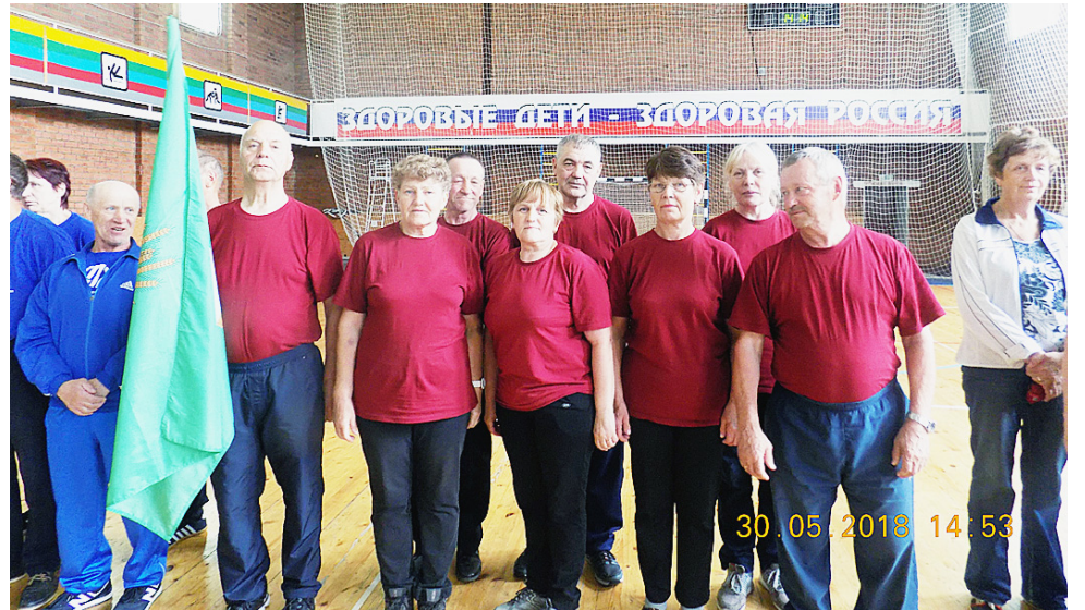
Команда участников Спартакиады из Сямжи.

Приятно видеть, как представители старшего поколения разнообразят свою жизнь, делая ее ярче и активнее - трени-